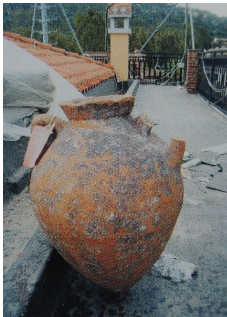
Fig. 1 - Amphore à corps ovoïde provenant de la mer d'Arbatax (SALVI ET ALII 2005, p. 72).

À la fin du VII e siècle av. J.-C., on commença à produire dans le sud de l'Étrurie des amphores destinées à l'exportation du vin de la région, qui durera jusqu'au III e siècle. Ces récipients ont été retrouvés dans différents villages côtiers de la péninsule italienne et dans de nombreuses épaves disséminées le long des côtes.