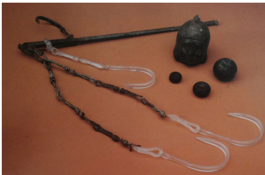
Fig. 4 – Balance de l'époque romaine (provenant du Musée archéologique « G.A. Sanna » de Sassari 2000, p. 151).

En faisant coulisser le poids le long de la tige, on atteint une position d'équilibre dans laquelle le bras gradué se place en position horizontale. La position du poids sur la tige indique donc le poids recherché. Le « poids » avait souvent la forme d'un petit buste humain ou d'une autre figure (fig. 4).