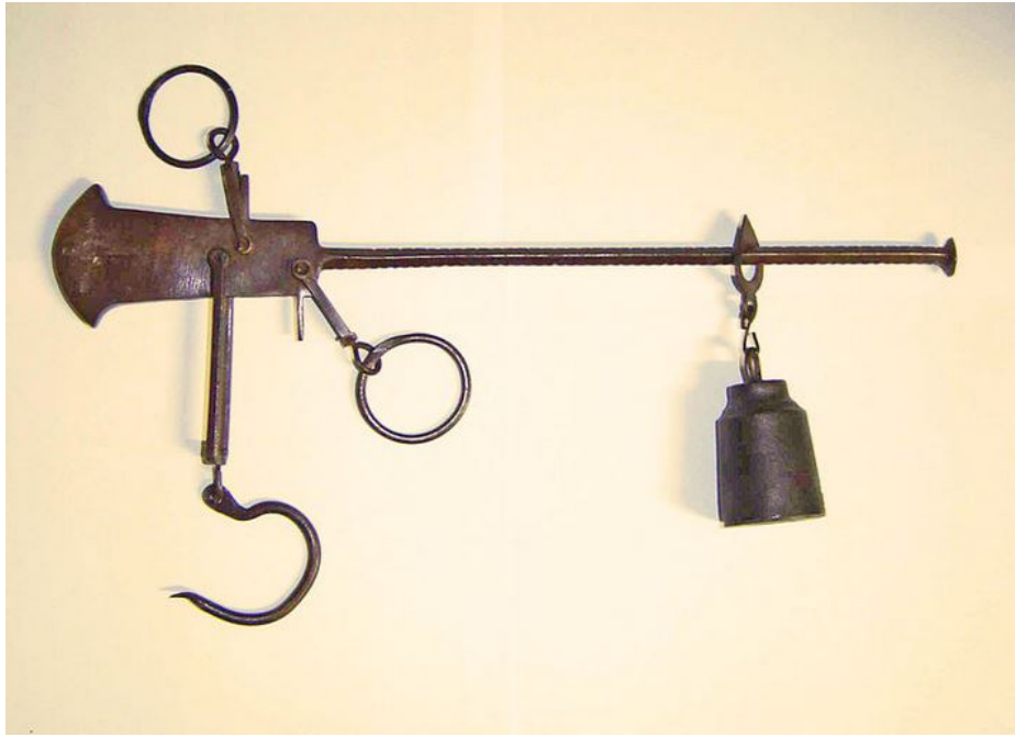
Fig. 1 - Balance de l'époque romaine.