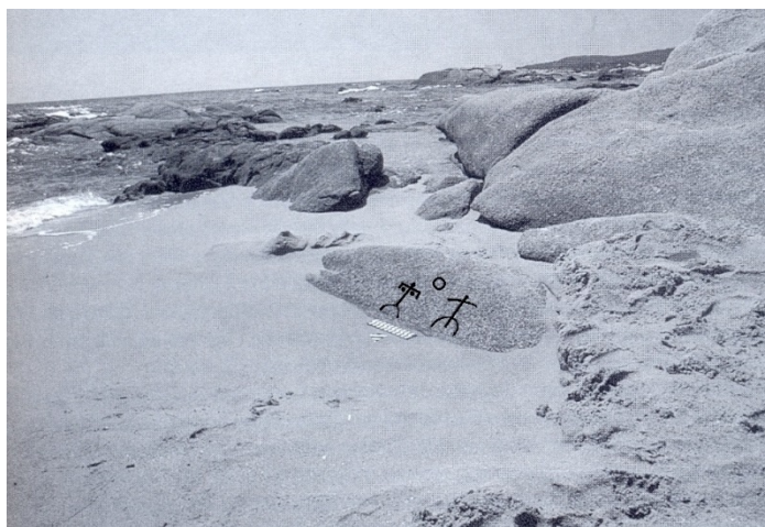
Fig. 2, 3 - L'écueil sur la plage d'Orrì avec le pétroglyphe (Archeo System 1990 a, p. 69).