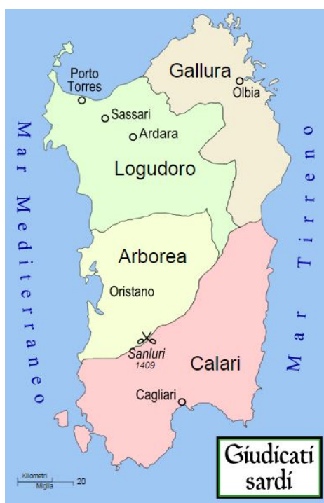
Fig. 1 - Les Judicats sardes du XI e au XIV e siècle ( http://upload.wikimedia.org/wikipedia/commons/c/c5/Giudicati_sardi_1.svg ).

Entre le VIII e et le IX e siècle, la Sardaigne s'éloigna graduellement de Byzance, et l'on parvint à la création de quatre zones administratives gouvernées par un Iudex, qui exerçait le pouvoir politique et militaire. C'est ainsi que naquirent les Judicats de Cagliari, Torres, Arborea et Gallura (fig. 1).