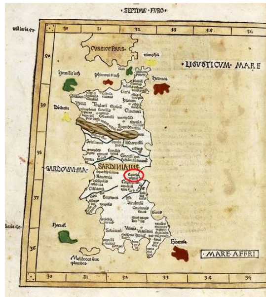
Fig. 4 - Septima Europe Tabula , in Ptolomeus Claudius, Cosmographia , Ulma, 1482. Le Sulpicius Portus est indiqué dans le cercle rouge ( http://www.sardegna-cultura.it/j/v/258?s=24292&v=2&c=2810&t=1# )