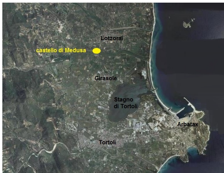
Fig. 3 - L'emplacement du château de Medusa par rapport à l'étang de Tortoli (Sardegnaonline ; réélaboration de M.G. Arru).

Les sources littéraires sont confirmées par des découvertes réalisées au cours des fouilles archéologiques de 1966 sur les ruines du château médiéval de Medusa a Lotzorai, à proximité de l'étang de Tortoli (fig. 3-4) 43 . C'est ici que furent identifiées certaines structures en maçonnerie relatives à un bâtiment datant d'une époque précédente, comprise entre le IV e et le III e siècle avant notre ère sur la base de la technique de construction utilisée, identique à celle des bâtiments de la Sulki occidentale (S. Antioco). Cette datation est également confirmée par les vestiges de culture matérielle et par la position stratégique sur une hauteur, modeste, certes, (25 mètres au-dessus du niveau de la mer), qui fait penser un bâtiment de type militaire ou religieux.