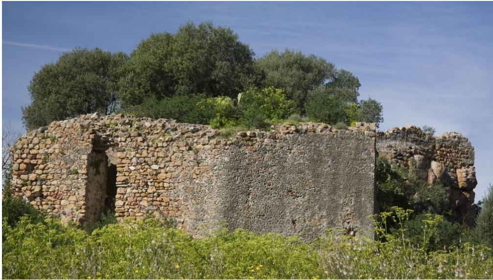
Fig. 4 - Les ruines du château de Medusa, Lotzorai ( http://www.sardegna.digitallibrary.it/index.php?xsl=615&s=17&v=9&c=4461&id=253747 ).

La découverte de fragments en terre cuite carthaginois et romains sur l'îlot de l'Ogliastra, face à l'étang de Tortolì, confirme ultérieurement la présence carthaginoise sur la côte est.