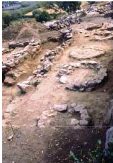
Fig. 4 - Les silos du village nuragique de S'Ortali 'e su Monte (FADDA 2012, p. 46, fig. 66)

À l'intérieur des cabanes du village, les archéologues ont retrouvé de nombreuses meules, des pilons et des broyeurs (réalisés avec des galets de rivière) pour traiter le blé ainsi que