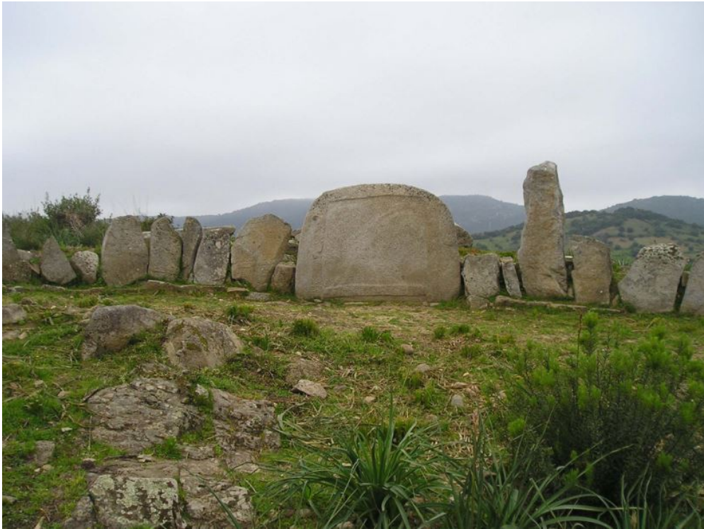
Fig. 3 - La tombe des géants de S'Ortali 'e su Monte.