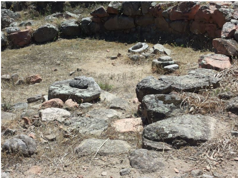
Fig. 5 - Cabane du village nuragique de S'Ortali 'e su Monte avec des meules, des pilons et des broyeurs.

des fragments de récipients de grandes dimensions pour la conservation des céréales (fig. 5).