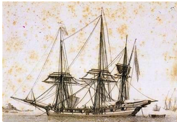
Fig. 5 - Chébec (BAUGEAN 1817).

Les corsaires agissaient surtout du printemps jusqu'à l'automne et, dans une moindre mesure, en hiver. Les galères et les autres embarcations à rames étaient utilisées en été, tandis qu'on se servait surtout des bateaux à voile en hiver pour exploiter les vents violents.