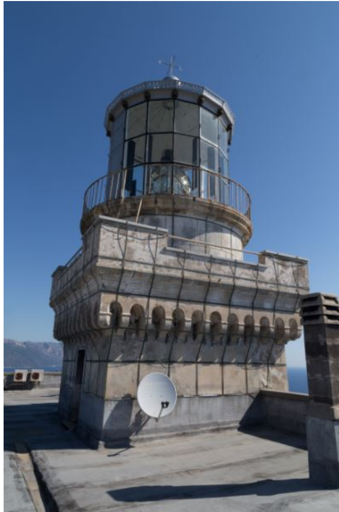
Fig. 3 - Le sommet du Phare avec la cage de Faraday.

Le bâtiment, sur deux niveaux, est constitué par deux logements et un bureau (fig. 4).