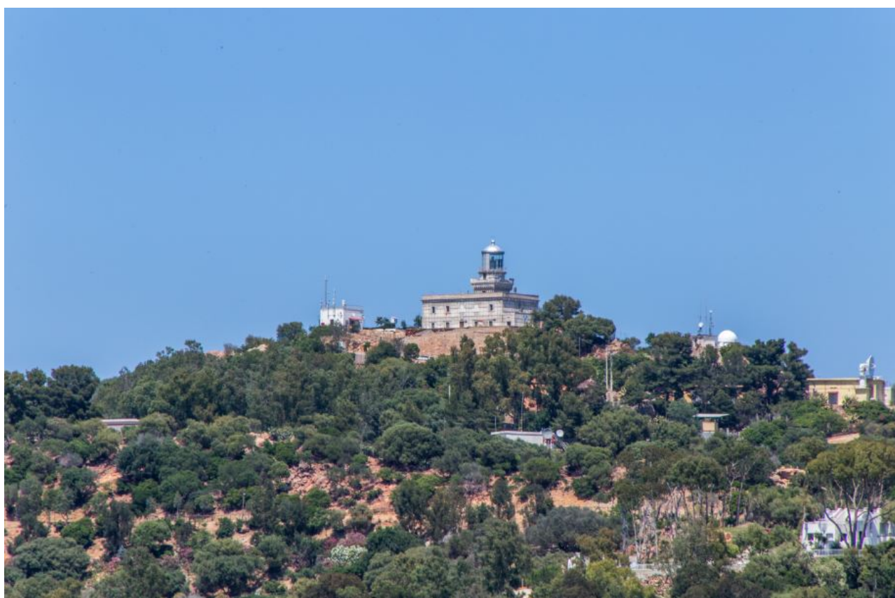
Fig. 1 - Promontoire du Cap Bellavista avec le Phare.

Sur le promontoire du Cap Bellavista, à 3 km d'Arbatax, à 165 mètres au-dessus du niveau de la mer, se dresse le Phare du Cap Bellavista (fig. 1).