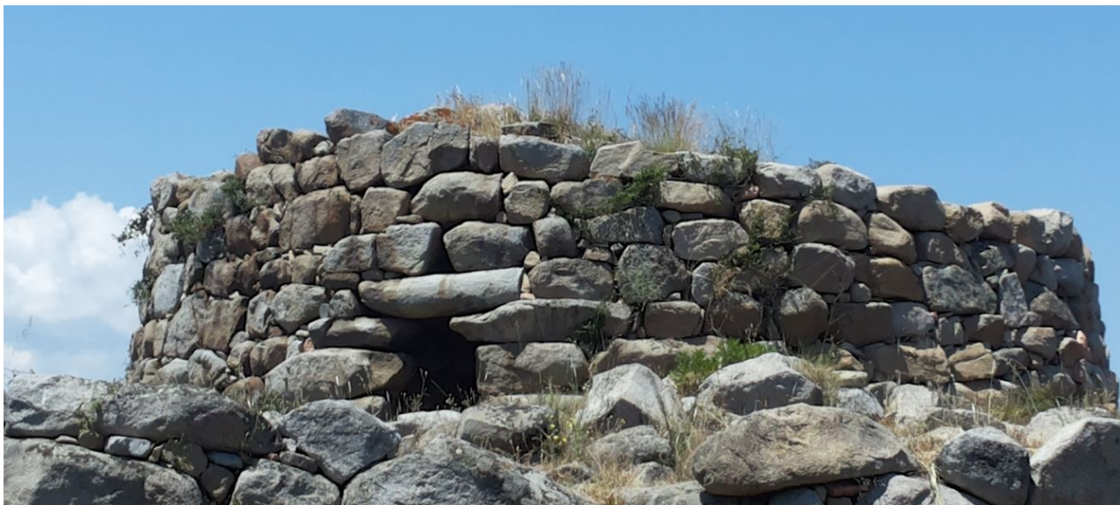
Fig. 2 - Nuraghe de S'ortali 'e su Monte : détail de l'entrée avec le menhir réutilisé comme architrave.

La tour centrale, dont on ne conserve qu'une partie d'une hauteur de 4,26 mètres, est munie d'une entrée orientée vers le sud et son architrave est constituée par un menhir brisé ayant appartenu aux phases de la période prénuragique (fig. 2-3).