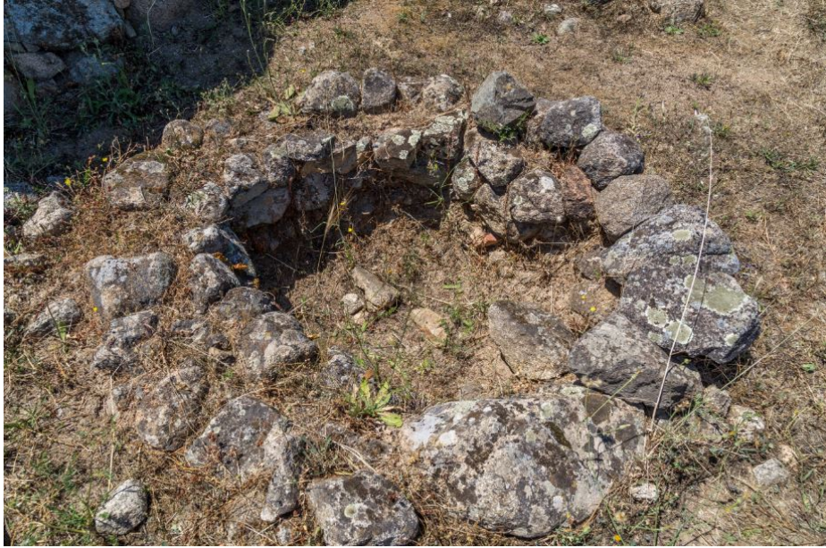
Fig. 5 - Un des silos réalisés à côté du nuraghe de S'ortali 'e su Monte.