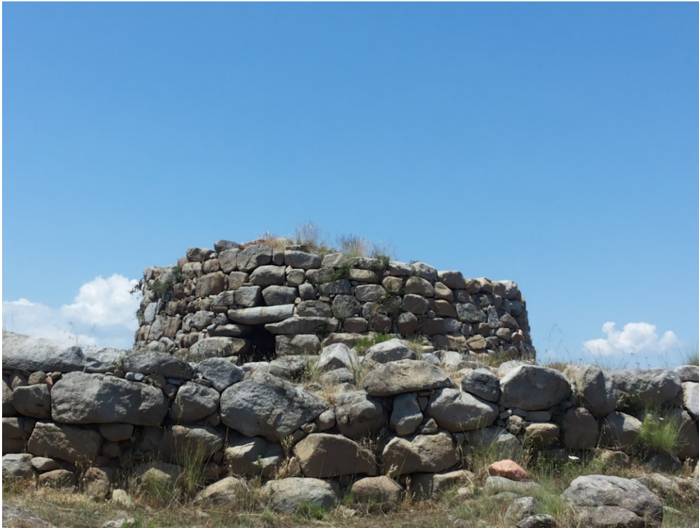
Fig. 3 - Le nuraghe de S'Ortali 'e su Monte.