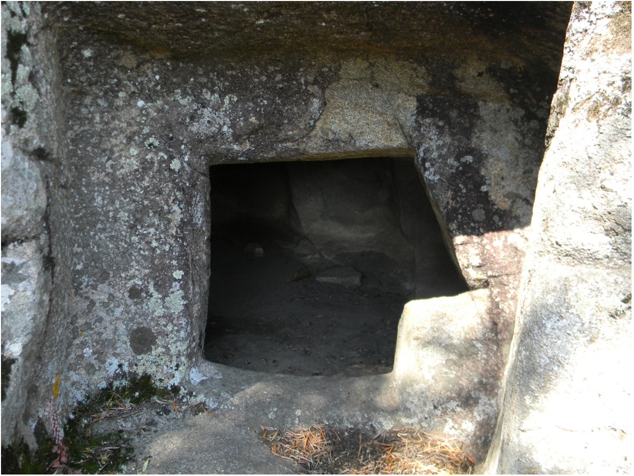
Fig. 1 - Domus de Janas dans la zone archéologique de S'Ortali 'e su Monte : détail de l'accès à la chambre interne.

En outre, différents menhirs, de type aniconique et de type proto-anthropomorphe datent eux aussi de la phase néolithique. Plusieurs menhirs et un bloc avec des cavités sont également visibles à côté de l'église champêtre San Salvatore (fig. 2) et leur présence pourrait être liée à la tombe souterraine creusée dans un éperon rocheux granitique à l'arrière du bâtiment religieux. Cette domus de Janas est constituée par deux cellules à extension longitudinale précédées d'un vestibule.