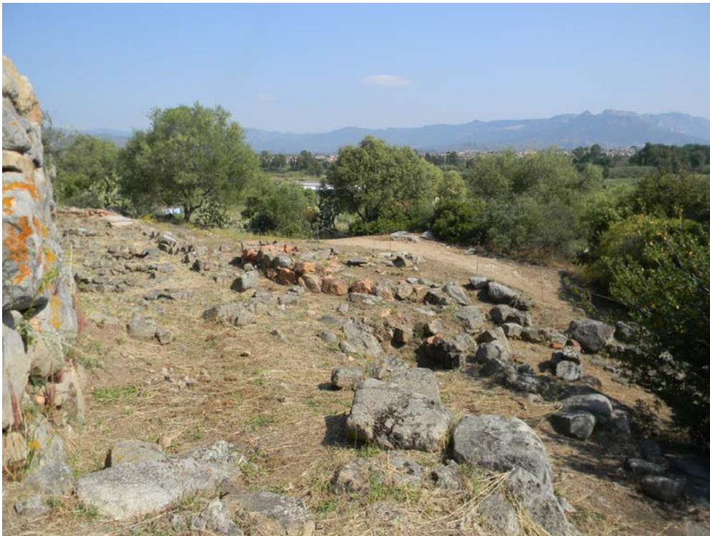
Fig. 4 - Structures du village qui entoure le nuraghe de S'Ortali 'e su Monte.