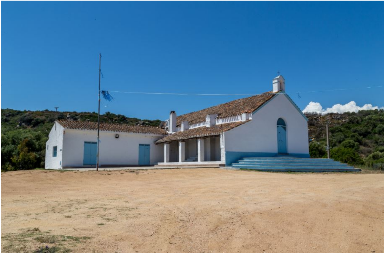
Fig. 2 - L'église champêtre San Salvatore.

Le site nuragique de S'Ortali 'e su Monte est constitué par un nuraghe à une tour, datant du Bronze Moyen, c'est-à-dire entre 1500 et 1400 av. J.-C., mais utilisé jusqu'à la période comprise entre la phase finale de l'Âge du Bronze et le premier Âge du Fer, vers 900 av. J.-C. (fig. 3), entouré d'une braie, qui englobe trois tours, d'un village comptant différentes cabanes (fig. 4) et de deux tombes des géants (fig. 5) qui accueilleraient les défunts ensevelis suivant le rite de l'inhumation.