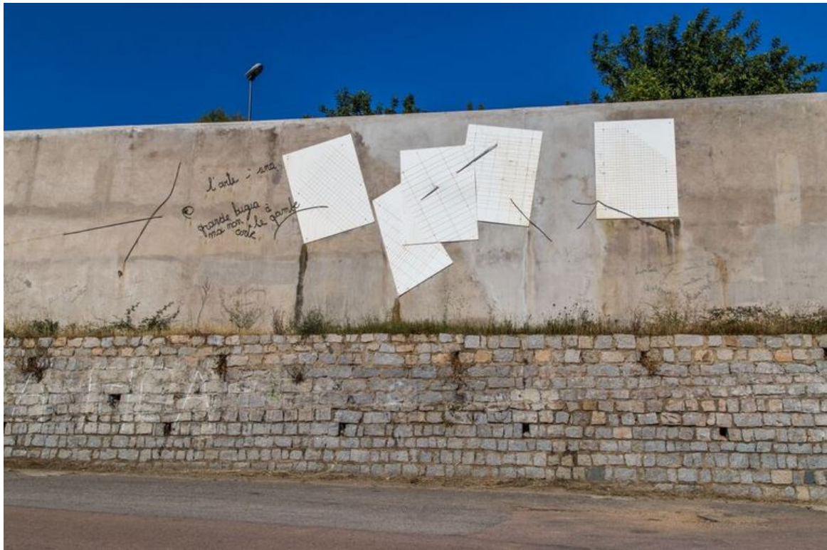
Fig. 2 - Via San Gemiliano : Tempo dell'Arte, de Maria Lai.