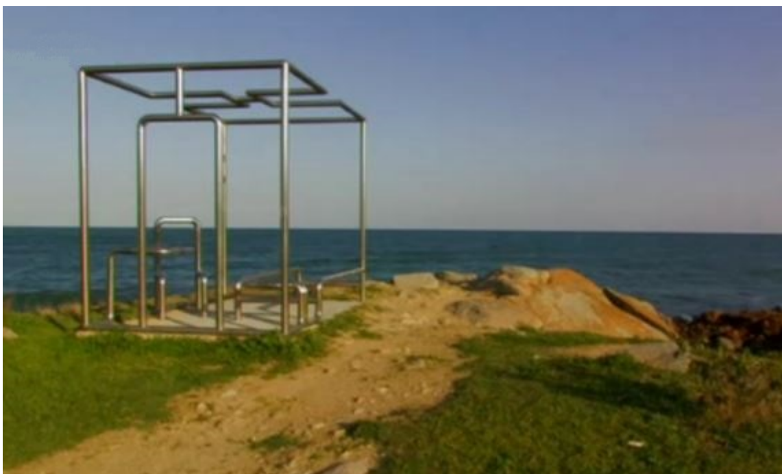
Fig. 4 - Plage d'Orrì : Cella Osservatorio di Stella, de Massimo Kaufmann ( http://www.sardegnaigitallibrary.it/index.php?xsl=626&s=17&v=9&c=4460&id=555748 ).