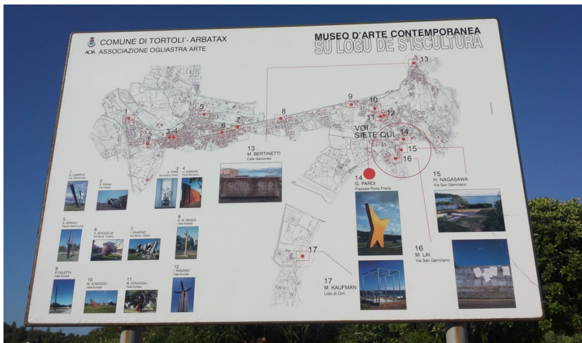
Fig. 1 - Panneau illustrant ce les emplacements des sculptures.

Le long du parcours, on peut admirer des œuvres de Maria Lai (fig. 2), Giovanni Campus (fig. 3), Massimo Kaufmann (fig. 4), Mauro Staccioli (fig. 5), Antonio Levolella, Umberto Mariani (fig. 6), Ascanio Renda, Iginò Panzino, Alex Pinna (fig. 7), Hitetoski Nagasawa, G. Pardi (fig. 8).