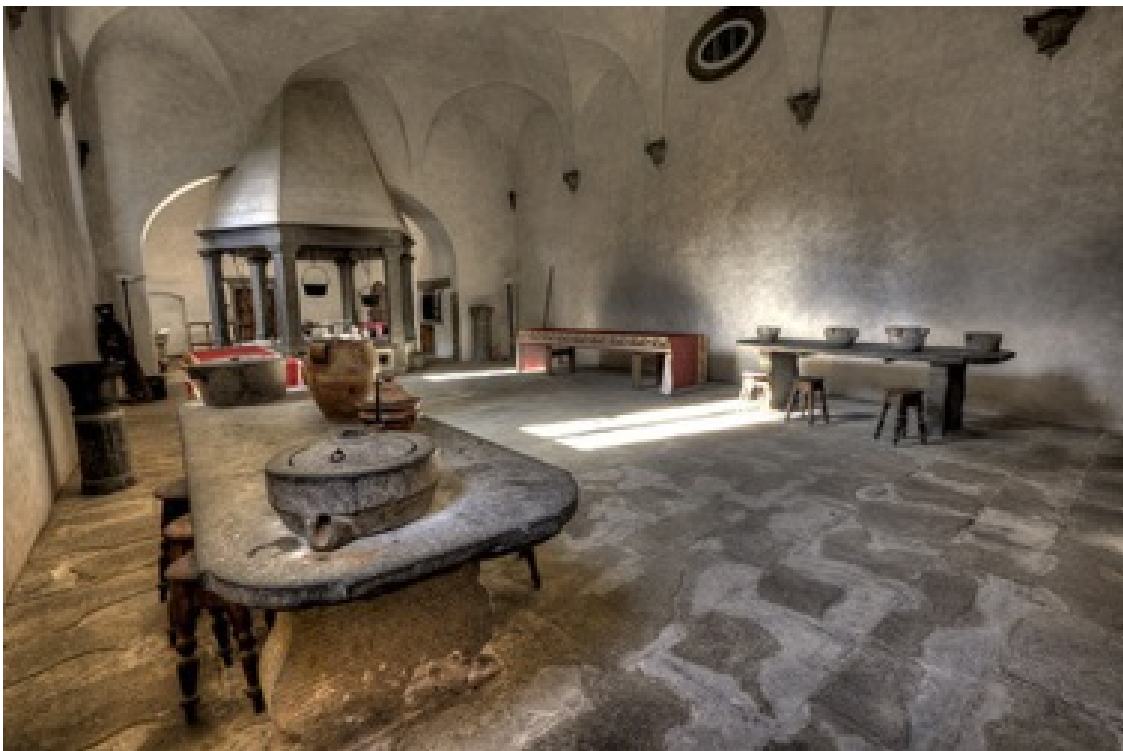
Fig. 1 - Cuisine de Vallombrosa.

Selon la règle bénédictine, les moines camaldules se distinguent par une capacité organisationnelle accentuée, par l'importance portée à la prière canonique, par l'obligation de la résidence du Moine dans le monastère, mais surtout pour la reconnaissance de l'importance du travail manuel (travail agricole) et intellectuel (étude, transcription de code ; fig. 1-5).