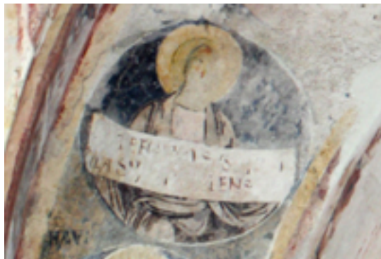
Fig. 3 - Les fresques de l'arc absidal : figure d'un prophète.