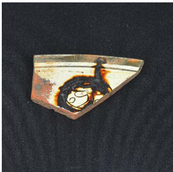
Fig. 1 - Luogosanto, Château de Baldu : fragment de Zeuxippus Ware (surface interne), (photo Unicity S.p.A.)

Un des objets les plus précieux parmi ceux utilisés dans la tour était probablement une écuelle de Zeuxippus Ware (fig. 1-2), produite entre la fin du XII e et le XIII e siècle de notre ère. Au cours des fouilles, on a retrouvé un fragment de lèvre présentant une décoration à graffiti réalisée à l'ébauchoir pour créer un sillon profond à peine en dessous du bord caractérisé par une bande vert foncé, et un motif « en palmette stylisée à l'intérieur de deux cercles concentriques ».