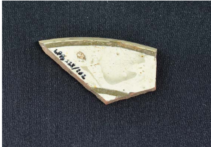
Fig. 2 - Luogosanto, Château de Baldu : fragment de Zeuxippus Ware (surface externe), (photo Unicity S.p.A.)

Les caractéristiques de cet exemplaire permettent de l'intégrer à la classe II identifiée par A. H. S. Megaw en 1968 : ce groupe présente une décoration à bande vert foncé obtenue en éliminant l'engobe blanc qui recouvre la surface interne du récipient. On appliquait par-dessus un émail qui prenait généralement une couleur crème avec des tonalités différentes à certains endroits.