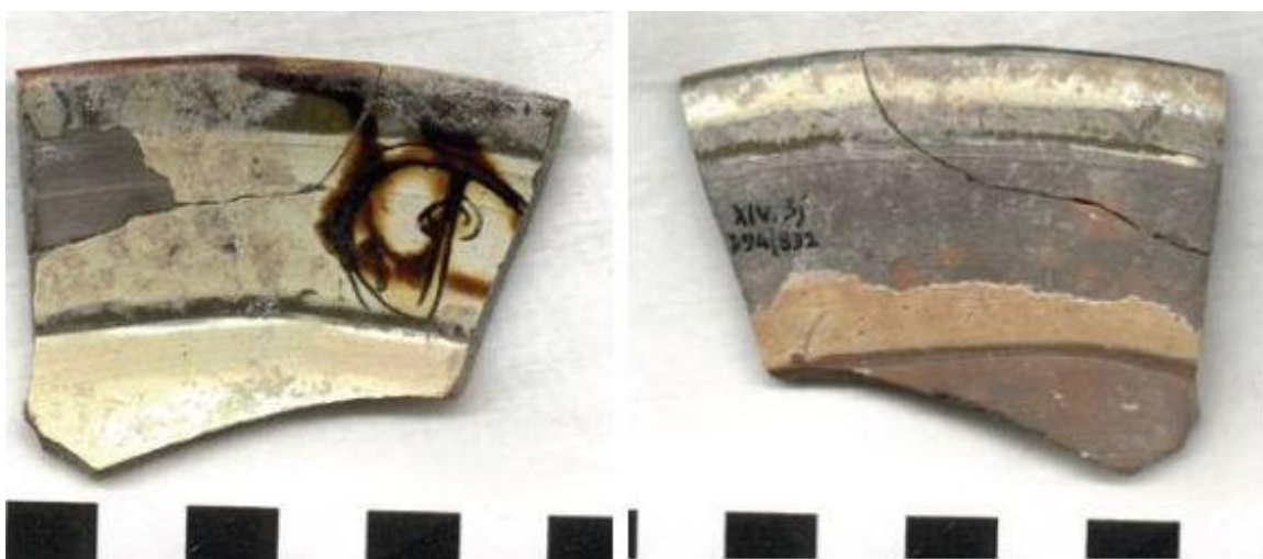
Fig. 3 - Grèce, Ilio : fragment (recto et verso) de Zeuxippus Ware ( http://classics.uc.edu/troy/grbpottery/html/byz-glazed.html ).

Les lieux de production de cette classe de céramique sont plus précisément des cités de la mer Égée et de Grèce (fig. 3), mais la première localité productrice était Constantinople et ses environs.