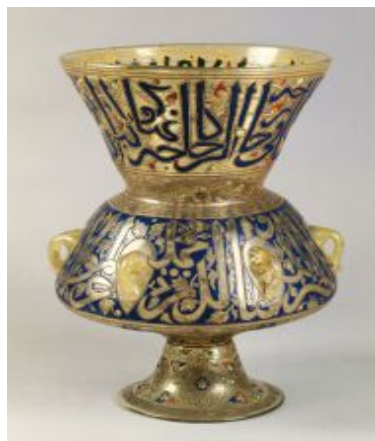
Fig. 5 - Berlin, Musée d'Art Islamique, Pergamon Museum : lampe provenant d'une mosquée ( http://www.discoverislamicart.org/exhibitions/ISL/the_mamluks%20/exhibition.php?theme=2&page=2 ).