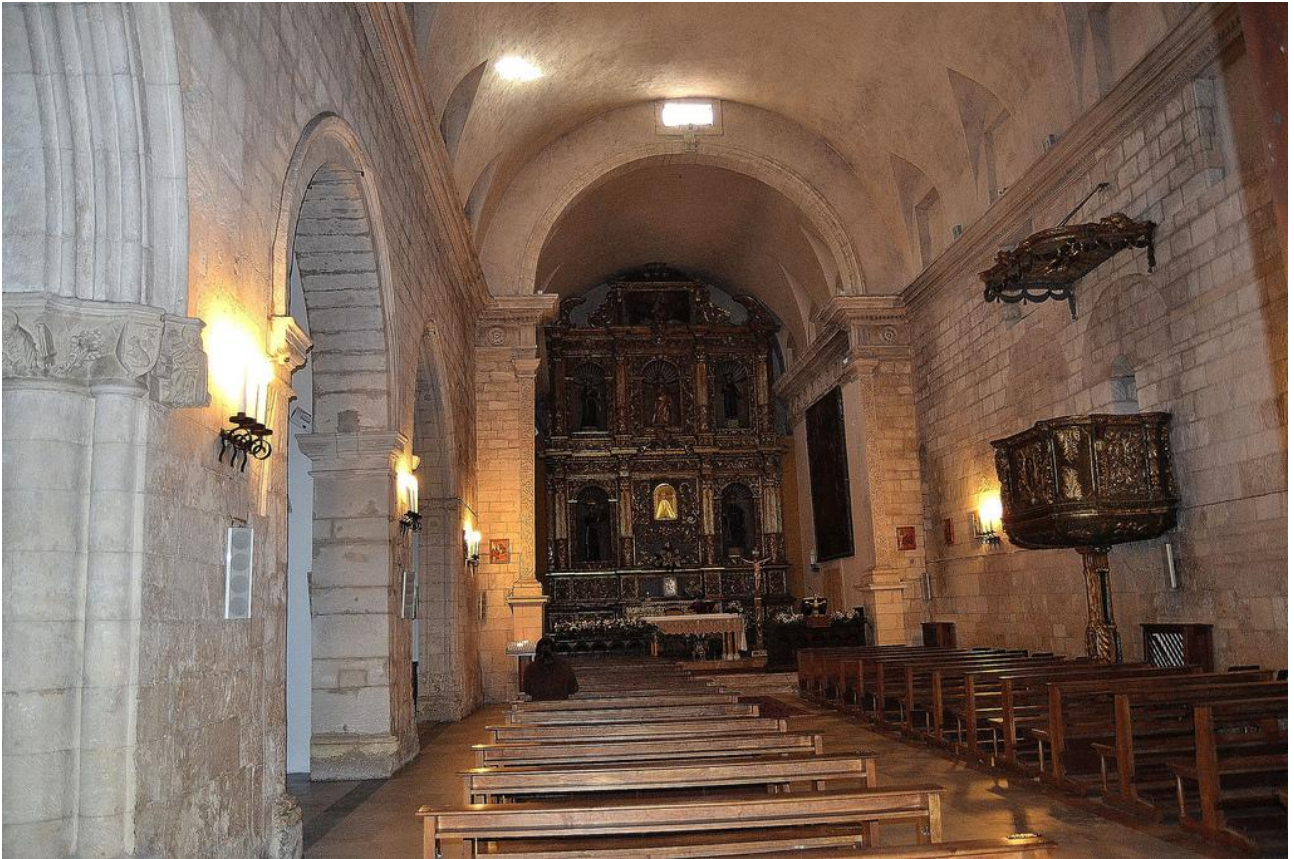
Fig. 4 - Sassari, église San Pietro de Silki : intérieur ( https://www.flickr.com/photos/piante_e_fiori_della_sardegna/11293227425 ).