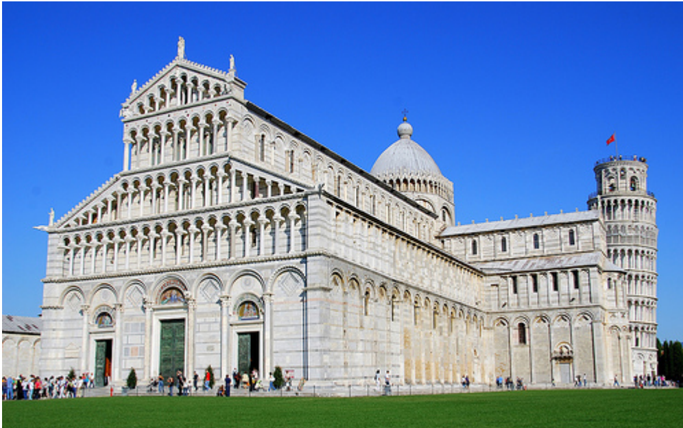
Fig. 3 - Pise : Cathédrale Santa Maria Assunta ( http://europass-blog.europass.it/cosa-fare-in-toscana-pisa/ ).

au degré de métropolitain d'un de ces derniers qui aurait étendu sa juridiction exclusivement sur le diocèse restant. Pour conjurer l'ingérence dans cette circonstance des trois Judicats majeurs, on opta pour le rattachement des deux diocèses au Saint-Siège, jusqu'en 1138 lorsqu'Innocent III établit leur annexion au siège métropolitain de Pise (fig. 3).