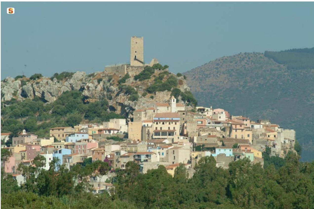
Fig. 2 - Posada, château de la Fava ( http://www.sardegna.digitallibrary.it/index.php?xsl=615&s=17&v=9&c=4461&id=62931 ).

Les Visconti devinrent les promoteurs d'une activité intense relative à l'enchâtellement de la Gallura : il fortifièrent les bourgs de Civita, Posada et Orosei et bâtirent les châteaux de Pedresu (Olbia), de la Fava (Posada - fig. 3) et de Pontes (Galtelli), où ils résidaient lorsqu'ils étaient loin de la Civita. Après leur exil de Pise, celle-ci fonda Terranova et poursuivi l'œuvre de construction à travers laquelle elle restructure à profondément le territoire de la Gallura.