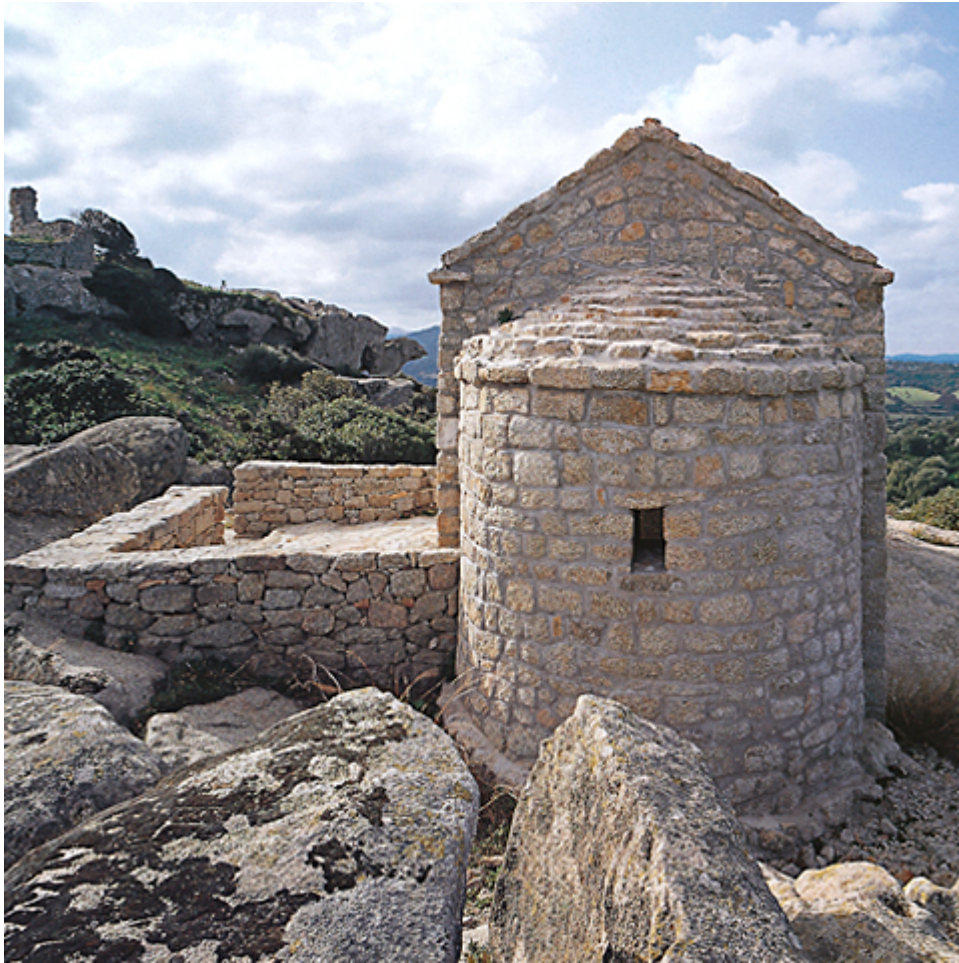
Fig. 4 - Église San Leonardo, abside : vue de l'est ( http://www.sardegnaacultura.it/j/v/277?s=7&v=9&c=2488&notizia=17905&pic=1 ).

Ses dimensions réduites ont permis d'imaginer qu'elle avait été utilisée pour les offices de la garnison du château et, en raison de sa conformation, elle semblerait dater de la deuxième moitié du XII e siècle de notre ère. Des structures analogues ont été retrouvées en Corse, permettant de supposer la présence d'une main-d'œuvre spécialisée dans le travail du granit au cours de la période romane.