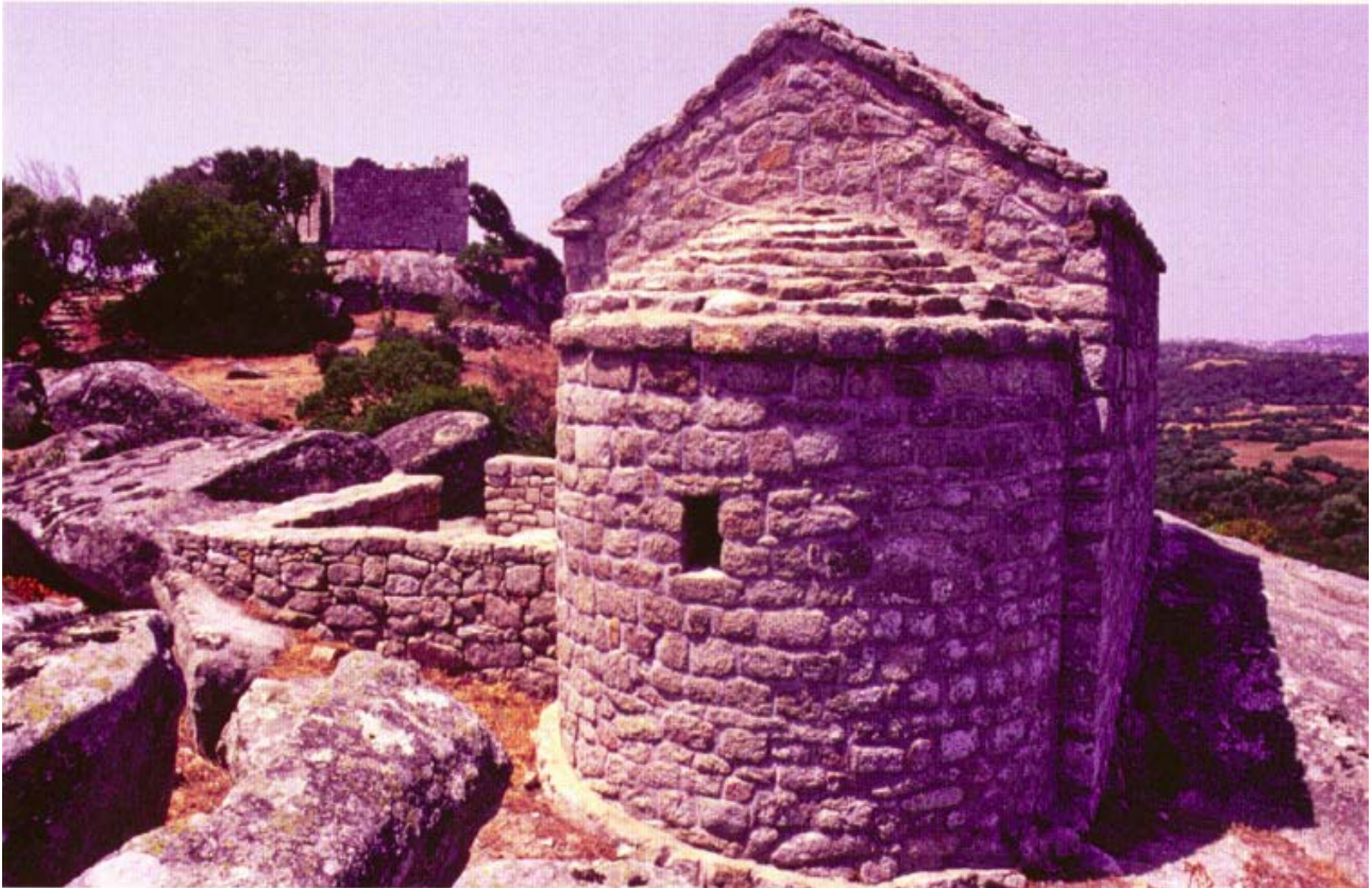
Fig. 1 - Luogosanto, église San Leonardo : au fond le château de Balaiana (PINNA 2008, p. 102, fig. 81).

À trois km à vol d'oiseau du château de Baldu, se dresse le château de Balaiana, encore relié aujourd'hui par un sentier à un second affleurement rocheux sur lequel se dresse l'église dédiée à Saint-Léonard qui est l'ancienne chapelle du château (fig. 1).