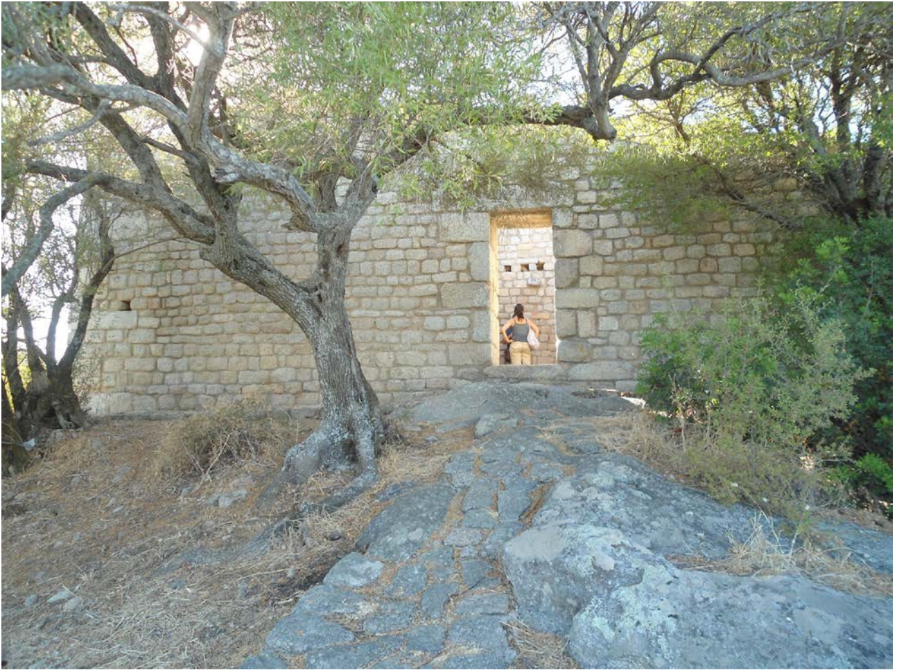
Fig. 3 - Luogosanto, château de Balaiana, côté est.

L'existence d'alignements en pierre dans la plaine environnante pourrait être l'indice de la présence d'autres structures relatives au château dont la fonction était d'empêcher l'accès provenant de toutes les directions.