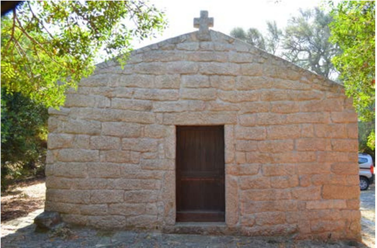
Fig. 5 - Façade de l'église Santo Stefano.

L'église est encore utilisée à l'occasion de la fête dédiée au Saint, le deuxième dimanche de mai.