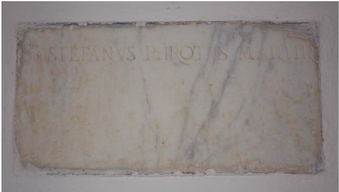
Fig. 3 - Luogosanto, Église Santo Stefano : épigraphe en marbre (photo F. Collu).

À proximité de l'entrée latérale, on aperçoit un bénitier en céramique vitrifiée monochrome (fig. 4) qui a peut-être remplacé le bénitier découvert dans les couches de gravats à proximité du four à briques : les débris du récipient fabriqué en Ligurie à la fin du XIX e siècle présente des points communs avec la pièce utilisée à San Semplicio de Lu Macchietu.