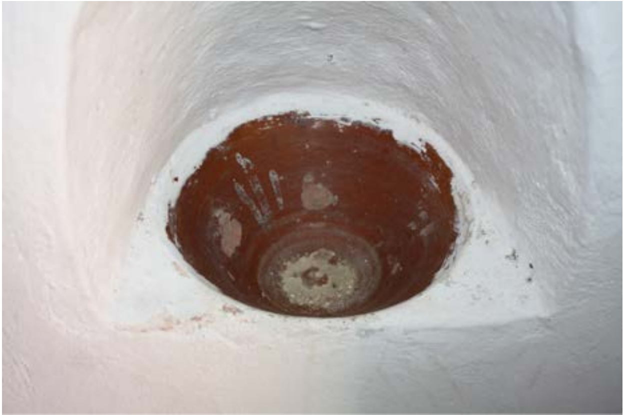
Fig. 4 - Luogosanto, Église Santo Stefano : bénitier en céramique vitrifiée monochrome.

Son architecture simple dénote un goût post-médiéval (fig. 5) mais elle a peut-être été construite au-dessus d'une église médiévale antécédente : cette hypothèse est renforcée par l'orientation habituelle vers l'Est et par la présence d'autres structures en maçonnerie autour de la nef. En outre, la dédicace à Saint-Stéphane la lie à la Villa de Sent Steva dans la curatoria de Balanyana mentionnée sur un document de 1358 : le village se trouvait sans doute à proximité du château, à quelques pas du lieu de culte.