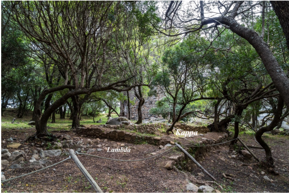
Fig. 3 - Château de Baldu : salles \lambda et \kappa , vue du sud-ouest.

La campagne de fouilles s'est terminée par la restauration des structures en maçonnerie et cette salle, qui étaient sur le point de s'écrouler en raison de l'action des racines des chênes-lièges entourant le complexe.