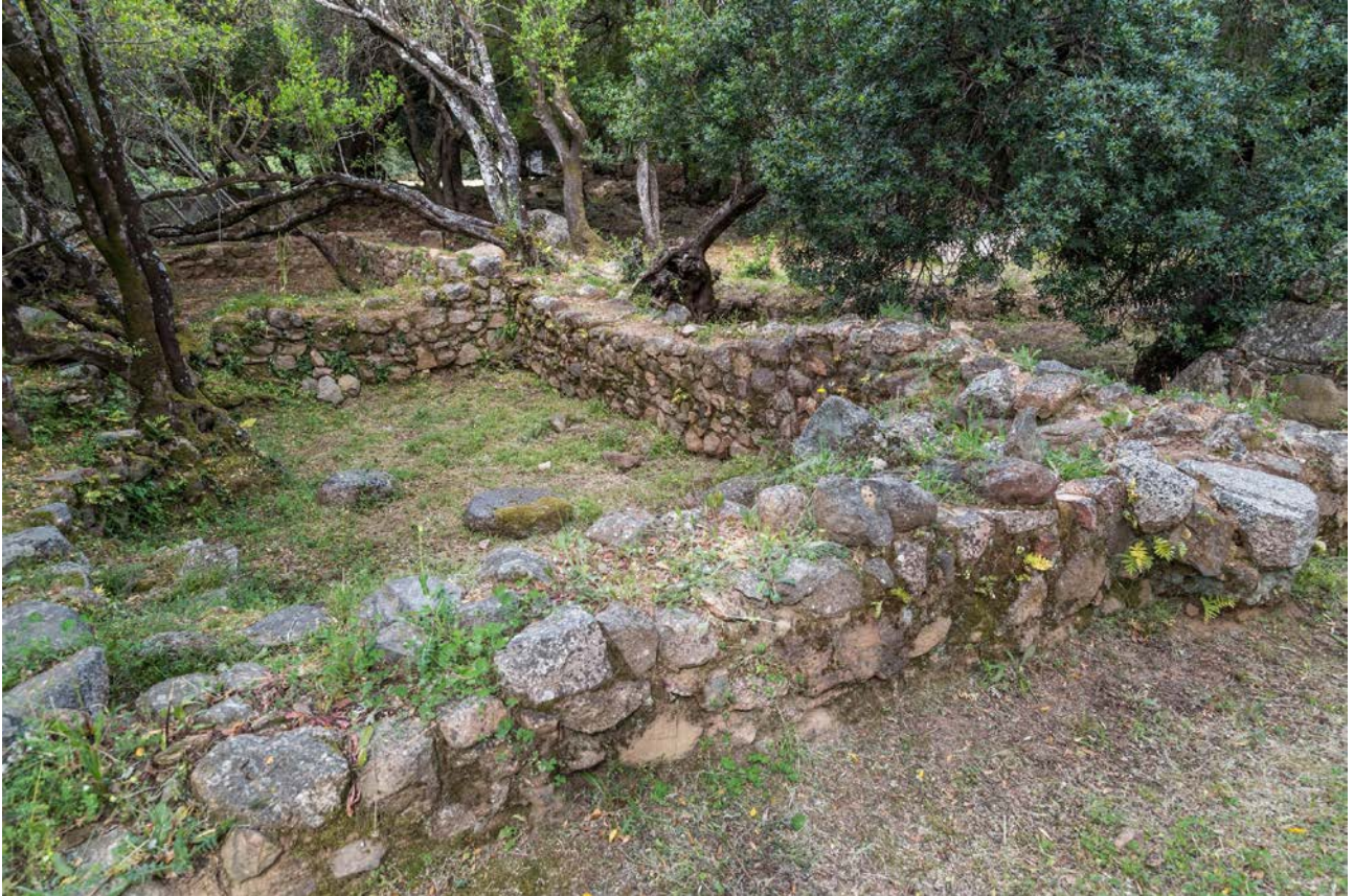
Fig. 2 - Château de Baldu : salles \iota et \kappa , vue de l'est.

Les fouilles ont également permis d'identifier un module de construction particulier, dit à « double salle », qui prévoit l'union de deux pièces (une pièce principale et une pièce mineure), à travers un accès, comme dans le cas des salles kappa ( \kappa ) et iota ( \iota ), (fig. 2-3) ; pi ( \pi ) et alfa ( \alpha ) ; csi ( \xi ) et ni ( \nu ).