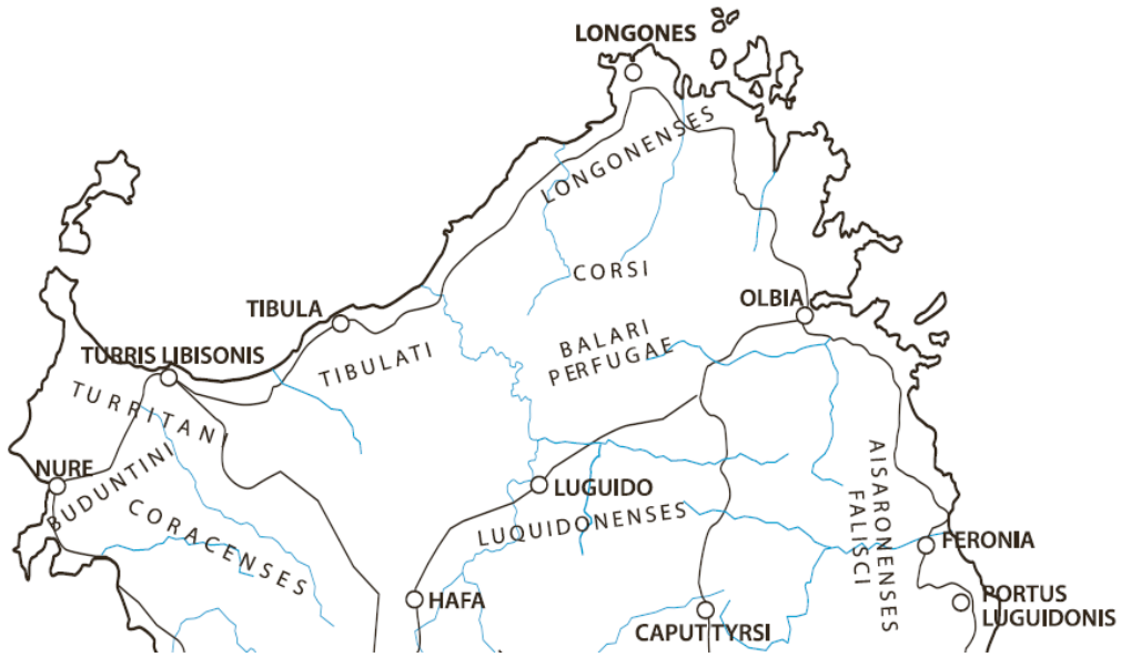
Fig. 2 - Les peuples non urbanisés de Sardaigne (MASTINO 2005 p. 307, fig. 35).

Ces derniers, qui étaient sans doute originaires de Corse, appartiennent au groupe des populations disséminées dans la région de la haute Gallura qui bloquèrent la colonisation phénicienne-carthaginoise (fig. 3) et qui compliquèrent celle de Rome.