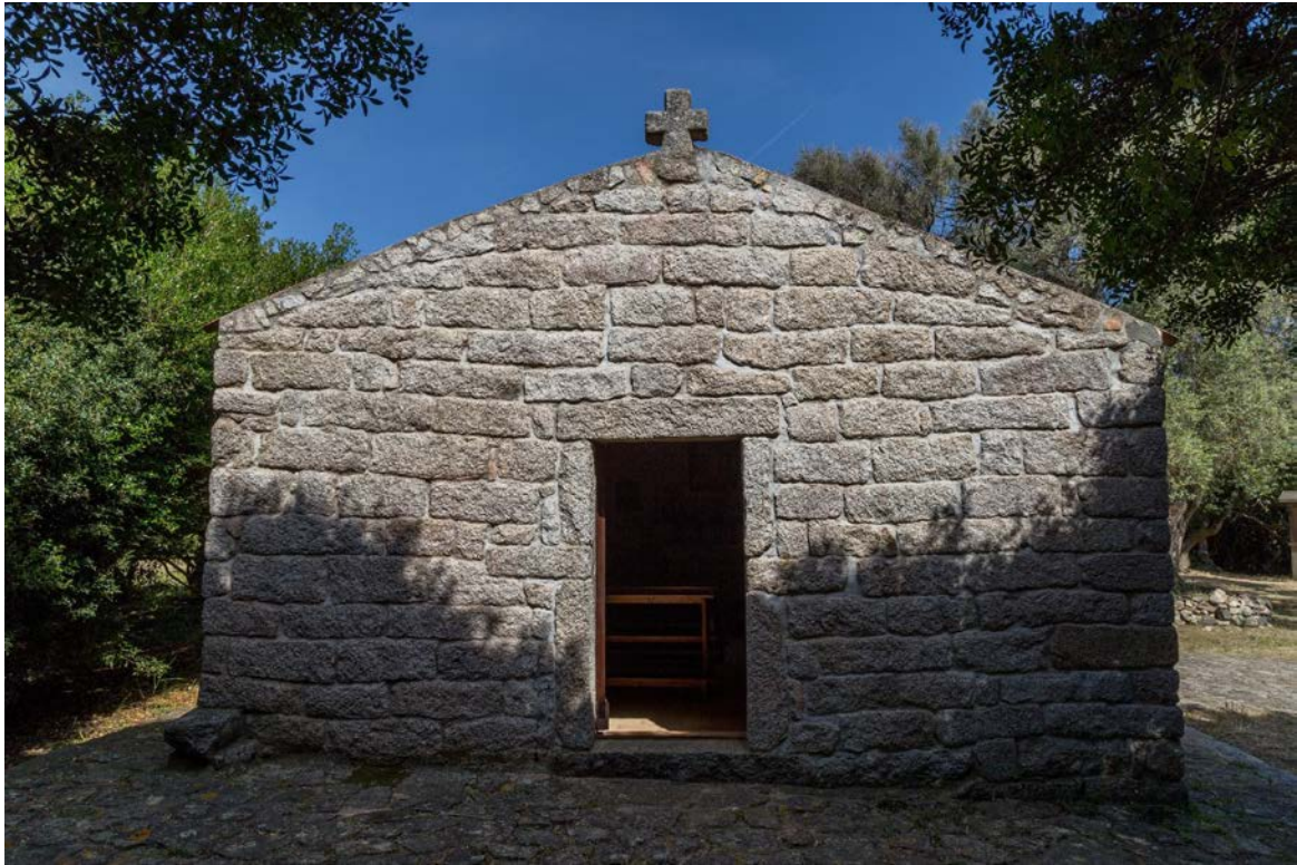
Fig. 7 - - Luogosanto, village de Santu Stevanu : église Santo Stefano.