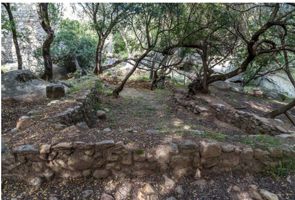
Fig. 6 - Château de Baldu : salle κ, vue de l'Ouest.

Le château était situé dans une zone naturellement protégée en raison de la dépression du terrain qui entourait le complexe et de la présence d'affleurements rocheux granitiques caractérisés par des tafoni dont la hauteur, dépassant les 10 m, dissimulait les deux niveaux Est et Sud-Est de la tour : ces derniers ont peut être exercé la fonction d'un véritable système de fortification.