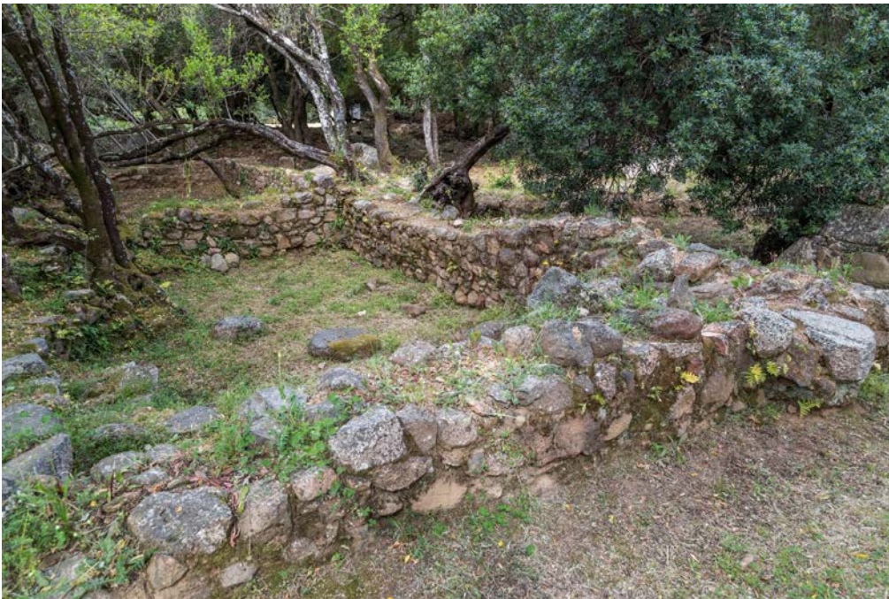
Fig. 5 - Château de Baldu : salles \iota et \kappa , vue de l'Est.

En l'état actuel des recherches, les locaux du complexe ont eu plusieurs fonctions : ils servaient tantôt d'habitation, tantôt d'atelier artisanal, comme le montrent par exemple les nombreux objets métalliques découverts dans les salles \beta (bêta) et \gamma (gamma) mais aussi d'entrepôts, de cuisines, d'étables et de boutiques. Les activités associées aux particularités de la tour, comme la technique de construction et l'ampleur des ouvertures, ont permis d'identifier le site comme un important centre administratif du territoire du Judicat de Gallura, ou encore comme la résidence d'un autre personnage politique et religieux parmi ceux qui ont joué un rôle déterminant dans le contrôle du royaume.