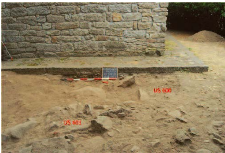
Fig. 8 - Luogosanto, village de Santu Stevanu : fouilles dans la zone à l'arrière de l'église Santo Stefano (Pinna, Corda a c.d.s., p. 150, fig. 7).

À proximité de l'église, les fouilles archéologiques ont mis au jour d'autres alignements en maçonnerie - révélant probablement la présence de structures qui n'ont pas encore été identifiées - et un four à briques (fig. 9) caractérisé par une structure à plan circulaire,