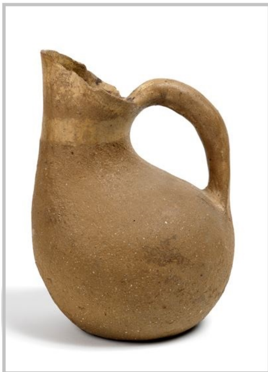
Fig. 4 - Askos du complexe nuragique de S. Anastasia, Sardara, VIIIe-VIe siècles avant notre ère (Bagella 2014, fiche 50, p. 239).