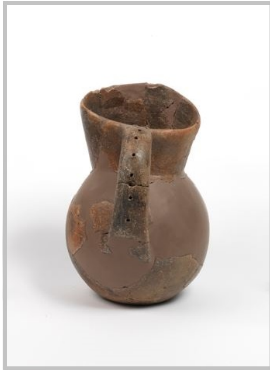
Fig. 2 - Askos de la zone archéologique de l'ancien hôtel de ville, Sardara, IXe-VIIIe siècles avant notre ère, détail de l'anse (Bagella 2014, fiche 46, p. 238).