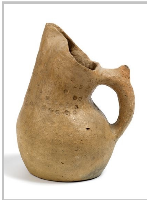
Fig. 3 - Askos du complexe nuragique de S. Anastasia, Sardara, IXe-VIIIe siècles avant notre ère (Bagella 2014, fiche 48, p. 238).