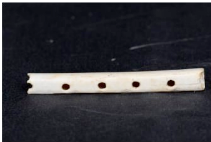
Fig. 1 - Fragment de flûte en os provenant du château de Monreale.

Au cours des investigations archéologiques réalisées en 1992 à l'intérieur du château de Monreale, on a identifié un dépotoir, relatif aux différentes phases de la vie du donjon, qui a restitué une quantité considérable d'objets en céramique, en verre et en métal. On a retrouvé en particulier une flûte en os très intéressante (incomplète), qui pourrait être le signe de l'existence d'un contexte royal dans le château, vu la présence probable de musiciens (fig. 1).