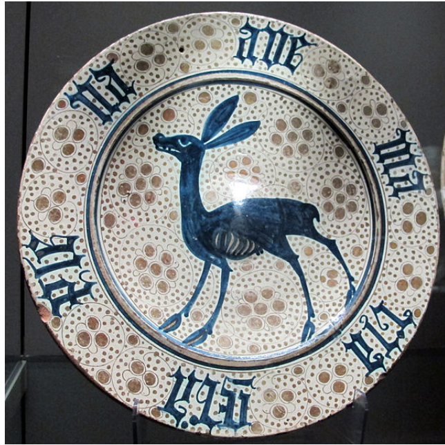
Fig. 3 - Exemple de cuvette de la « série de l’Ave Maria », Manises ( http://commons.wikimedia.org/wiki/File:Manises,_bacile_con_cerbiatto_e_iscrizione_ave_maria_gratia_plena,_1400-1450_ca..JPG ).