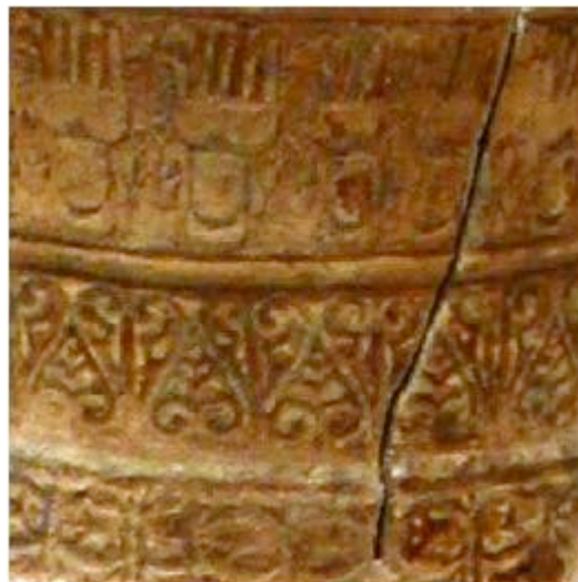
Fig. 4 - Détail de la décoration de la « jarre islamique » récupérée dans l'épave de Capo Galera (Alghero, Sassari).

En Sardaigne, un exemplaire de grande jarre a été récupéré dans l'épave de Capo Galera (Alghero, Sassari), une embarcation provenant des pays islamiques, probablement du