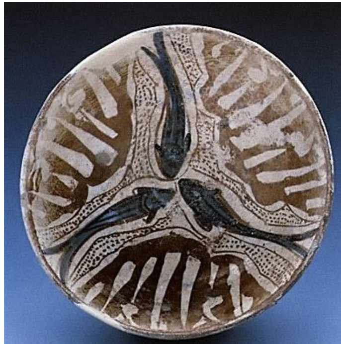
Fig. 4 - Pinacothèque Nationale de Cagliari, coupe appartenant au soi-disant « Fondo Pula » décorée en bleu et lustre ; deuxième quart du XIV e siècle ( http://www.pinacoteca.cagliari.beniculturali.it/imagePreview.php?id=229 ).

Le « Fondo Pula » comprend des objets en bleu et lustre parmi les plus significatifs (fig. 4). Il s'agit de 58 objets en céramique datant de la première moitié du XIV e siècle et retrouvés en 1869 à Pula, en province de Cagliari. Au cours des travaux d'agrandissement et d'aménagement de la route qui menait au Mont Granatico, on découvrit un dépôt creusé dans le terrain (une fosse rectangulaire de 1,20 X 1,00 m et d'une profondeur de 0,80 ; fig. 5) qui contenait de la vaisselle fabriquée à Valence, à Pise et en Ligurie, à Majorque et en Sicile. Il s'agit de la découverte la plus importante d'objets en céramique hispano-mauresques de Sardaigne. Actuellement, ces pièces sont conservées à la Pinacothèque Nationale de Cagliari.