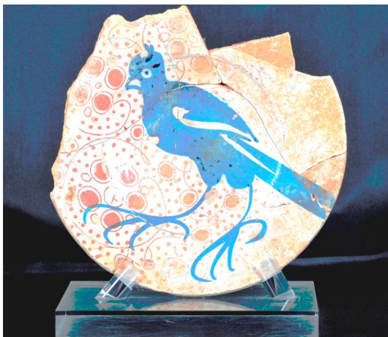
Fig. 1 - Assiette en faïence de Valence avec figure zoomorphe centrale de couleur bleue ; surface interne

La surface interne (fig. 1) est décorée en lustre avec le motif végétal des anillos con discos et, au centre un volatile (peut-être un paon ou un faucon) est représenté en bleu, tourné vers la gauche, avec de grandes pattes, un bec court et courbe, une houppe sur la tête et une longue queue qui atteint le bord le de l'assiette. L'extérieur de l'objet (fig. 2) est décoré en lustre avec un motif végétal stylisé, constitué par trois éléments en forme de feuille, et situé à l'intérieur de cercles irréguliers dessinés au trait fin.