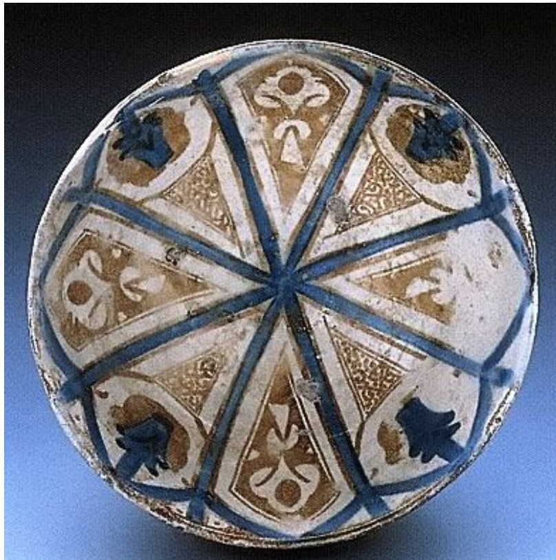
Fig. 3 - Pinacothèque Nationale de Cagliari, coupe appartenant au soi-disant « Fondo Pula » décorée en bleu et lustre ; deuxième quart du XIVe siècle ( http://www.pinacoteca.cagliari.beniculturali.it/imagePreview.php?id=229 ).

daient et adhéraient au corps en céramique. Pour réaliser la décoration en lustre, on appliquait sur la céramique une pâte de sels métalliques (oxyde d'argent ou de cuivre) et de l'argile dilué avec du vinaigre, avant de soumettre l'objet à une troisième cuisson à basse température, à environ 600 °C, pour éviter l'évaporation de la pellicule métallique sous l'effet d'une chaleur excessive. On utilisait pour cela des fours de petite dimension dans lequel on pouvait régler le tirage, car l'atmosphère devait être réductrice, donc sans oxygène. Il fallait donc fermer les ouvertures et utiliser des substances homogènes (bois frais, sucre, etc.) empêchant l'oxydation des métaux. Après le refroidissement, il fallait frotter la surface pour éliminer les résidus d'argile et de fumée et mettre le lustre en évidence. L'argent produisait une coloration jaune ou verdâtre, tandis que le cuivre devenait jaune, orange ou brun.