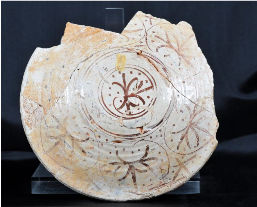
Fig. 2 - Assiette en faïence de Valence avec figure zoomorphe centrale de couleur bleue ; surface externe

La facture de l'objet évoque la maîtrise des artisans céramistes de Paterna et Manises, des villages situés à quelques kilomètres de Valence, spécialisés, entre le XIV e et le XVII e siècle, dans la production de faïences décorées de reflets caractéristiques dorés et bleu clair (fig. 3), demandées dans toute l'Europe où elles étaient importées par des marchands pisans, génois, milanais et vénitiens. La technique utilisée était celle du « lustre métallique », caractérisée par l'iridescence des ornements, largement éprouvée en Orient à partir du IX e siècle, et bien attestée dans la Péninsule Ibérique.