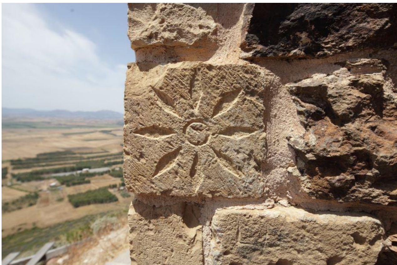
Fig. 2 - Élément décoratif dans les murs du donjon.