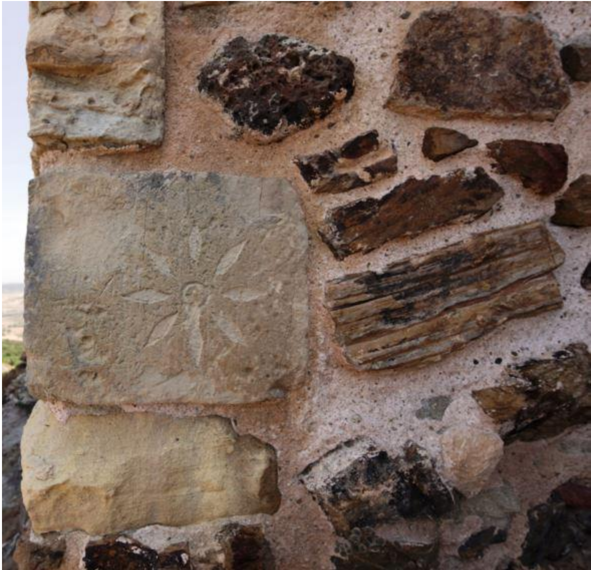
Fig. 3 - Élément décoratif inséré dans un mur du donjon.