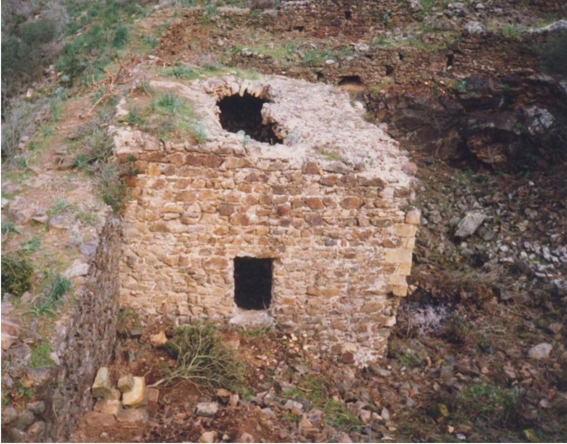
Fig. 5 - Su Zubu.