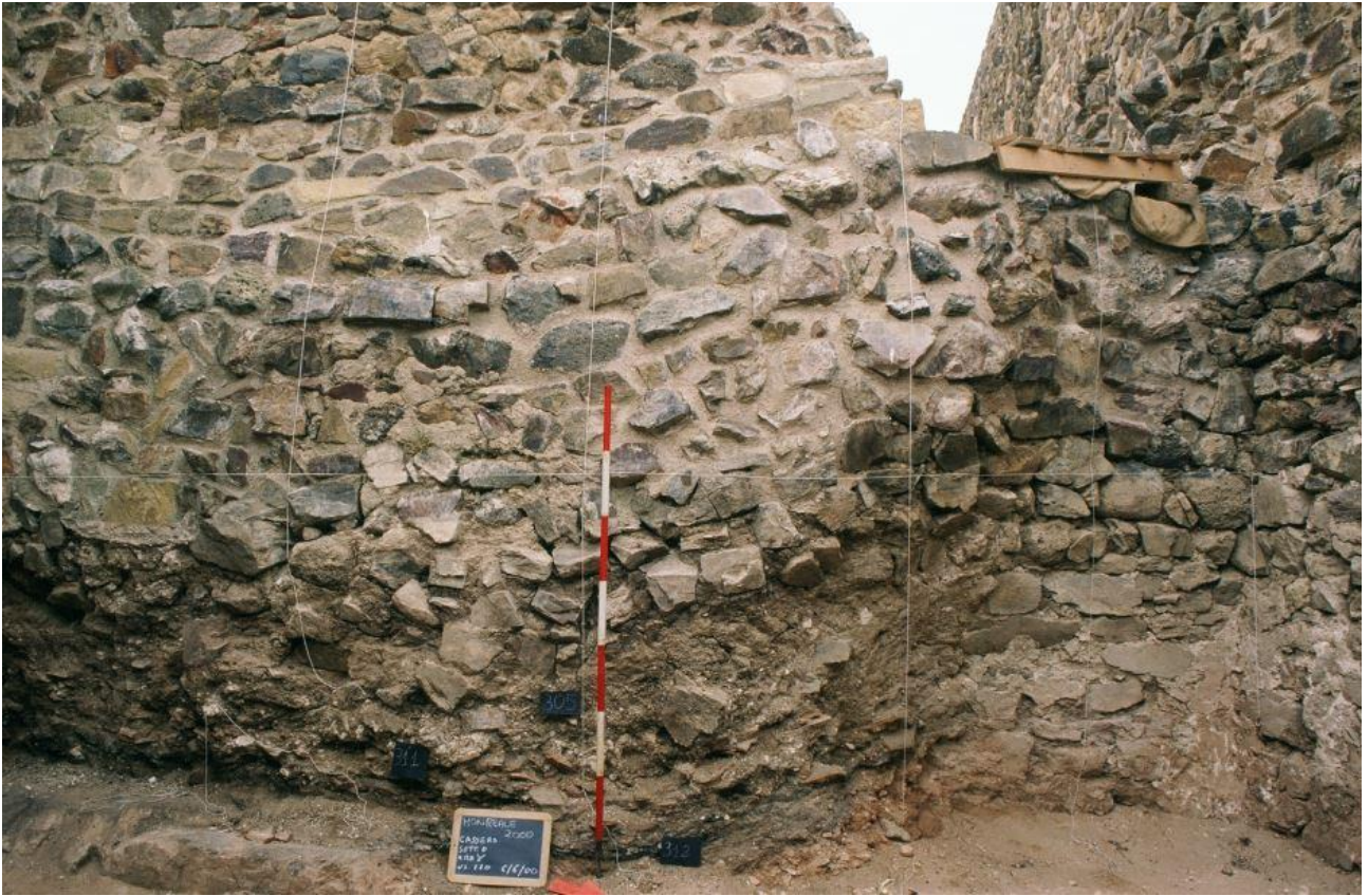
Fig. 4 - Intérieur de la salle gamma (réélaboration de M. G. Arru).