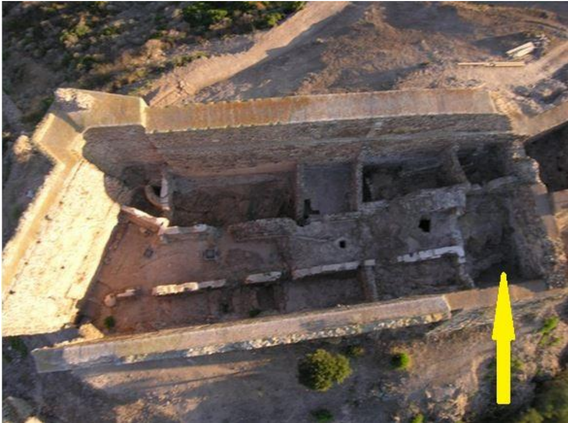
Fig. 2 - Le donjon vu du haut avec l'indication de la salle epsilon (réélaboration de M. G. Arru).