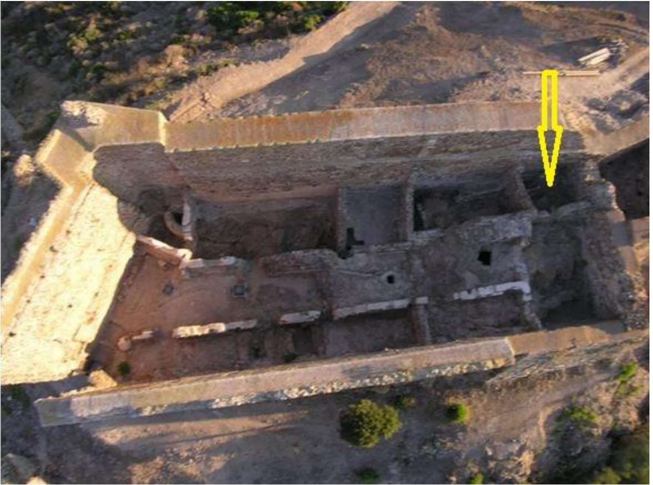
Fig. 2 - Le donjon vu du haut avec l'indication de la salle delta (réélaboration de M. G. Arru, photo de R. Bordicchia).