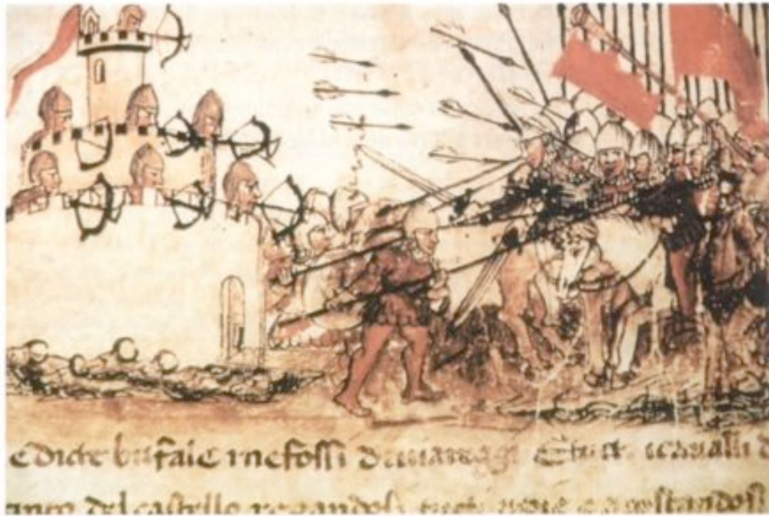
Fig. 3 - La défense d'un château (Monteverde, Fois 1997, p. 251).

réellement limité, vu qu'elles comptaient en moyenne de 10 hommes armés 2 . Ainsi, la différence entre le nombre de soldats et l'espace à défendre était démesurée, même si la connaissance du territoire et de l'environnement de la part des combattants pouvait expliquer une utilisation optimale de contingents décidément réduits 3 .