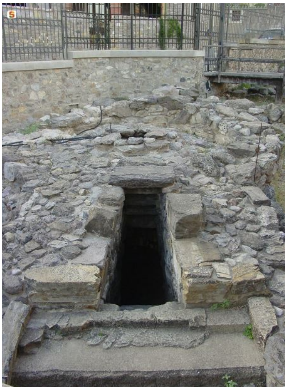
Fig. 3 - Le puits sacré de Sant'Anastasia.