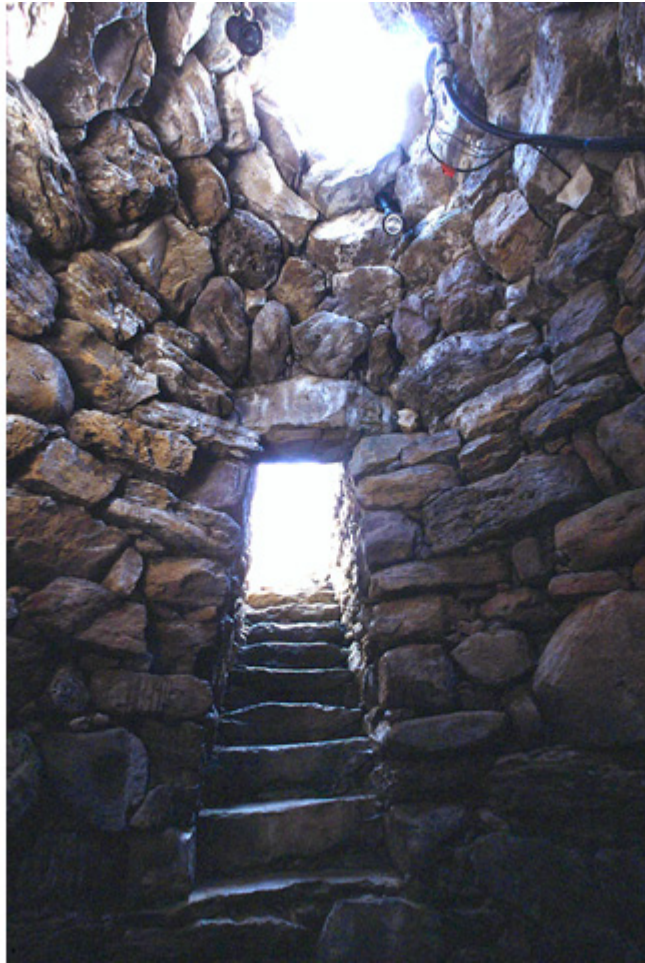
Fig. 4 - L'intérieur du puits sacré de Sant'Anastasia ( http://www.sardegna-cultura.it/j/v/277?s=7&v=9&c=2488-izia=20757&pic=4&ng=1 ).