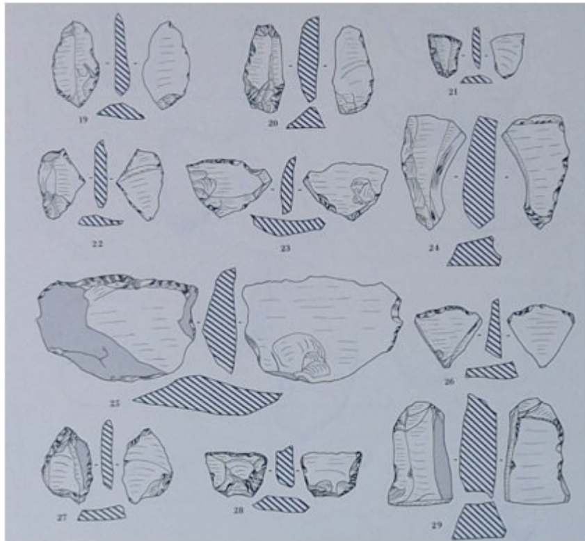
Fig. 1 - Instruments réalisés avec des éclats de pierre provenant du village préneuraïque de Pranu Sisinni (L. Usai 1988, p. 35).