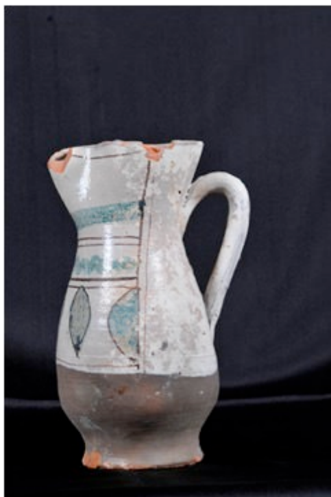
Fig. 5 - Pichet en faïence archaïque provenant du château de Monreale, datant du XIVe s..