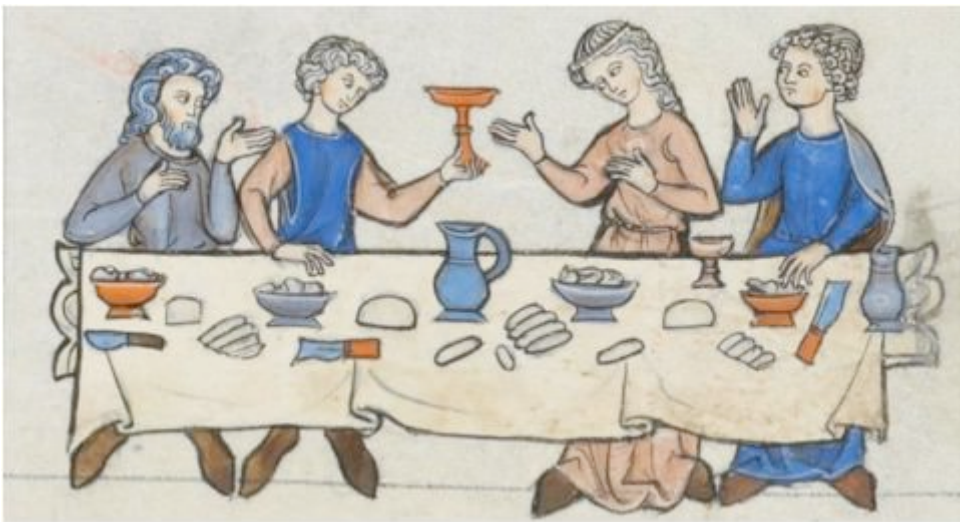
Fig. 4 - Banquet nuptial – miniature extraite de « Biblia Porta », XIIIe s. – Losanne, Bibliothèque Cantonale ( http://ilpalazzodisichelgaita.files.wordpress.com/2013/10/banchetto-nuziale.jpg ).