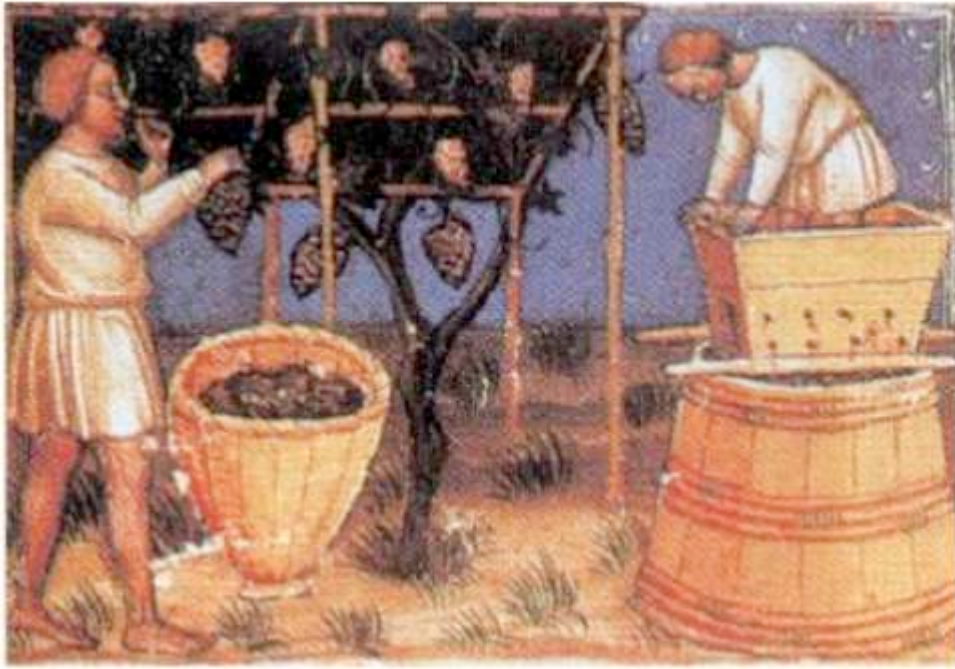
Fig. 2 - Miniature médiévale représentant le pressage du raisin dans le vignoble (B. MARCHISIO, La vite, la vigna, il vino nella Bibbia , Cavallermaggiore-Gribaudo 1999).

Les épices jouaient un rôle important : on les utilisait pour masquer les goûts « forts » du gibier, et on mettait souvent du miel dans le vin pour réduire le degré d'acidité.