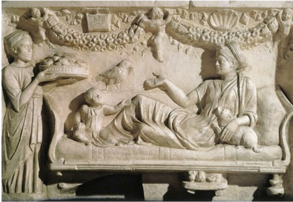
Fig. 3 - Scène de banquet à l'époque romaine : une esclave apporte le repas à la maîtresse de maison et à son enfant étendus sur le triclinium avec leur petit chien ( http://dizionariupi.zanichelli.it/storiadigitale/p/voce/5261/roma-antica#!prettyPhoto ).