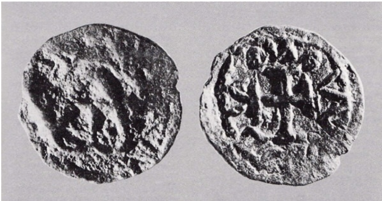
Fig. 4 - Trémisse de Léon III, retrouvé dans la nécropole de Part'e Sole (D'ORIANO et alii 1989, fig. 45).