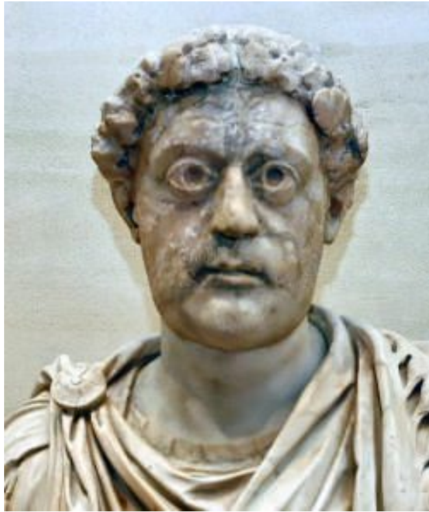
Fig. 3 - Léon III l'Isaurien, empereur d'Orient de 717 à 741 ( https://lifeondoverbeach.wordpress.com/2010/10/05/the-use-of-sacred-images-in-christian-worship-the-2nd-of-5-posts-on-iconoclasm/ ).