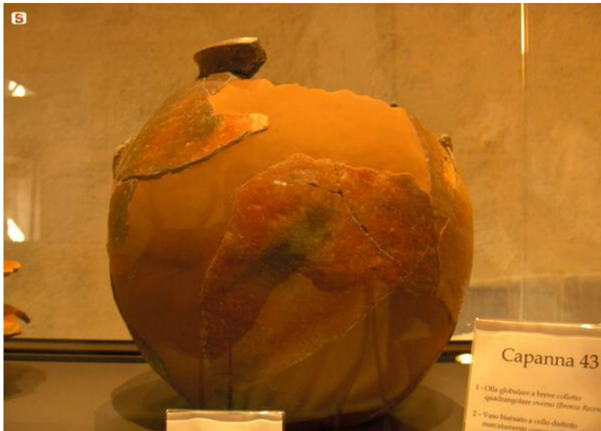
Fig. 3 - Urne globulaire provenant de Casa Zapata, Barumini ( http://www.sardegna.digitalibrary.it/index.php?xsl=615&s=17&v=9&c=4461&id=75953 ).