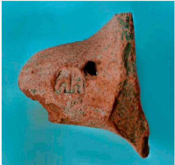
Fig. 2 - Anse avec timbre amphorique provenant de Posada (SANCIU 2012, fig. 7-8).