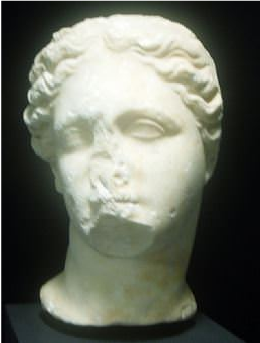
Fig. 2 - Tête de Féronie, IIe s. av. J.-C., Terracina ( https://it.wikipedia.org/wiki/Feronia#/media/File:Testa_di_Feronia_-_museo_archeologico_di_Rieti.jpg ).