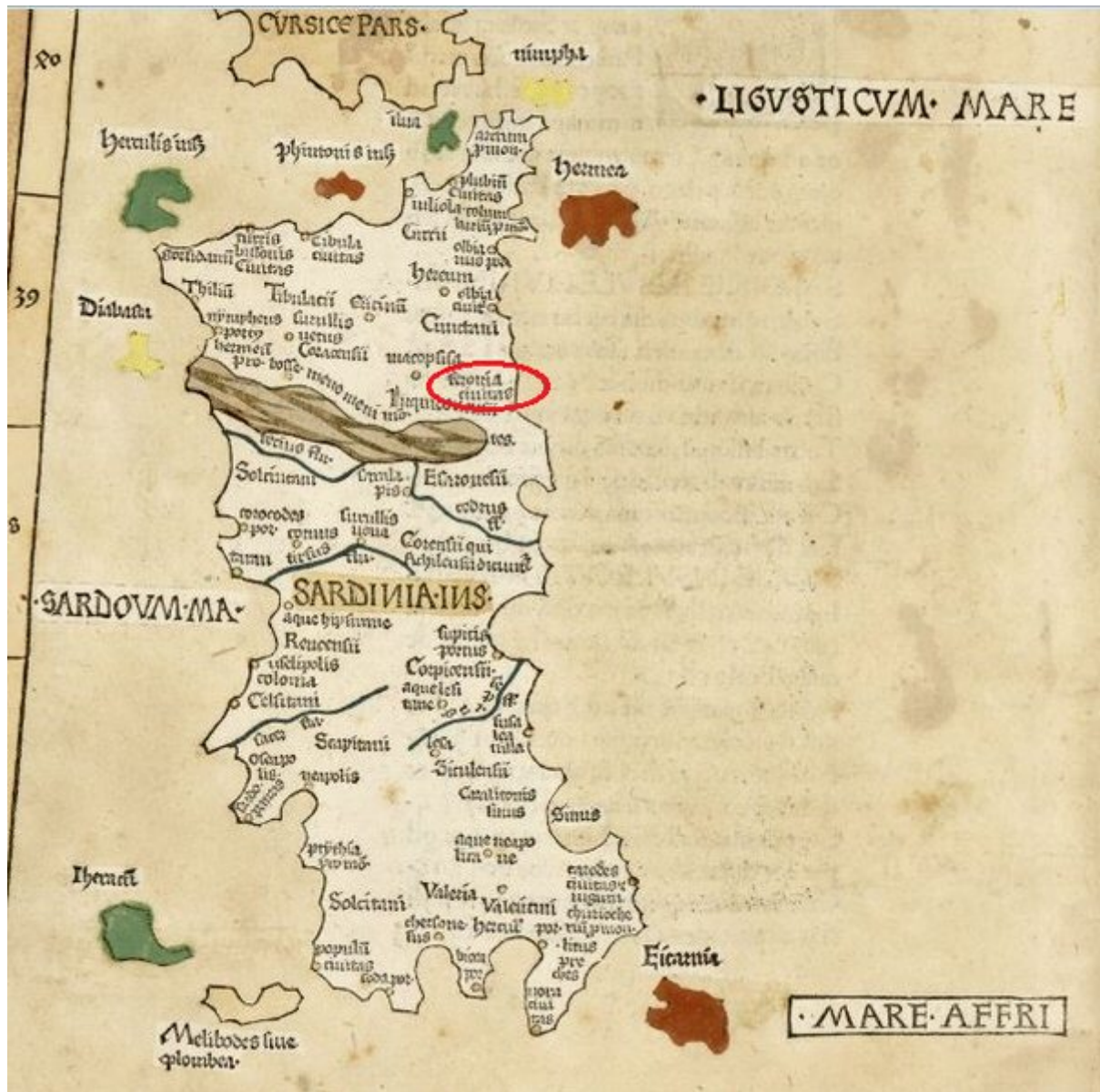
Fig. 3 - En rouge l'indication de « Feronia civitas » sur la carte Septima Europe Tabula , in Ptolomeus Claudius, Cosmographia , Ulma 1482 ( http://www.sardegnaultura.it/imghigh/001.jpg ).