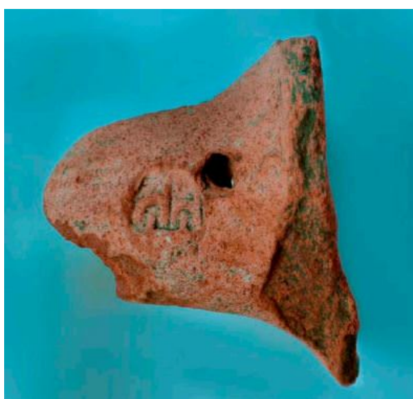
Fig. 2 - Anse avec timbre amphorique provenant de Posada (SANCIU 2012, fig. 7-8).