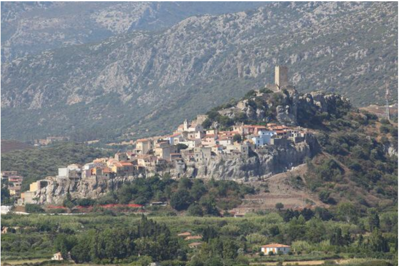
Fig. 1 - Le rocher de Posada vue du nord-est.

À l'Époque Nuragique, le rocher de Posada (fig. 1) n'était pas inhabité : certaines études menées ces dernières années ont permis de supposer que la zone dans laquelle se dresse le Château de la Fava était occupée par un nuraghe à couloir, au sud-est duquel se développait un village nuragique.