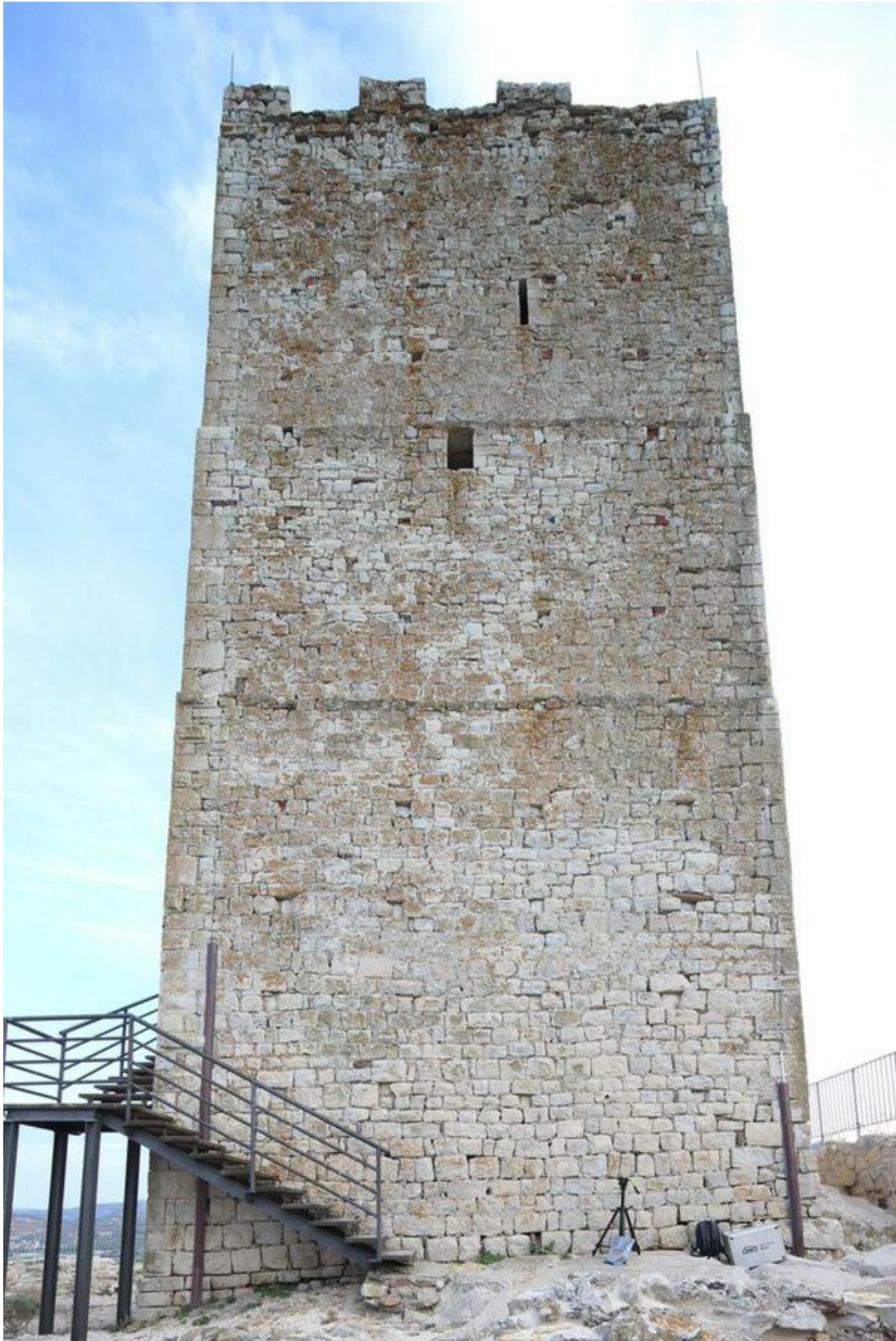
Fig. 4 - Le côté nord de la tour : on aperçoit dans le parement du mur les redents qui marquent les trois niveaux du bâtiment.