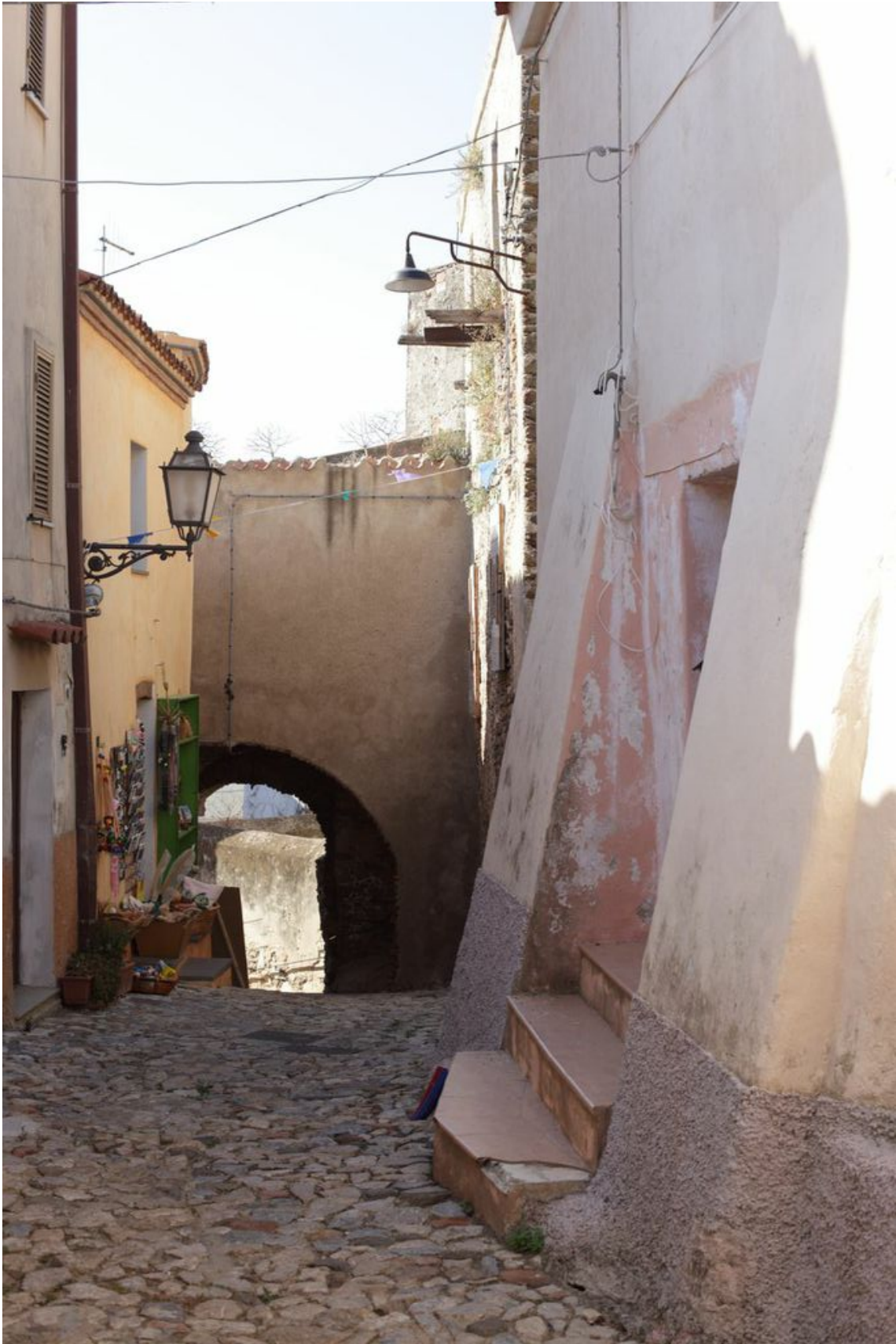
Fig. 4 - La deuxième porte vue de l'intérieur.