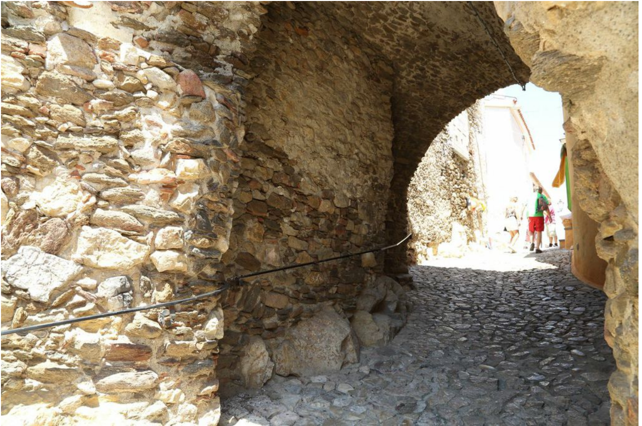
Fig. 3 - Passage à travers la deuxième porte.