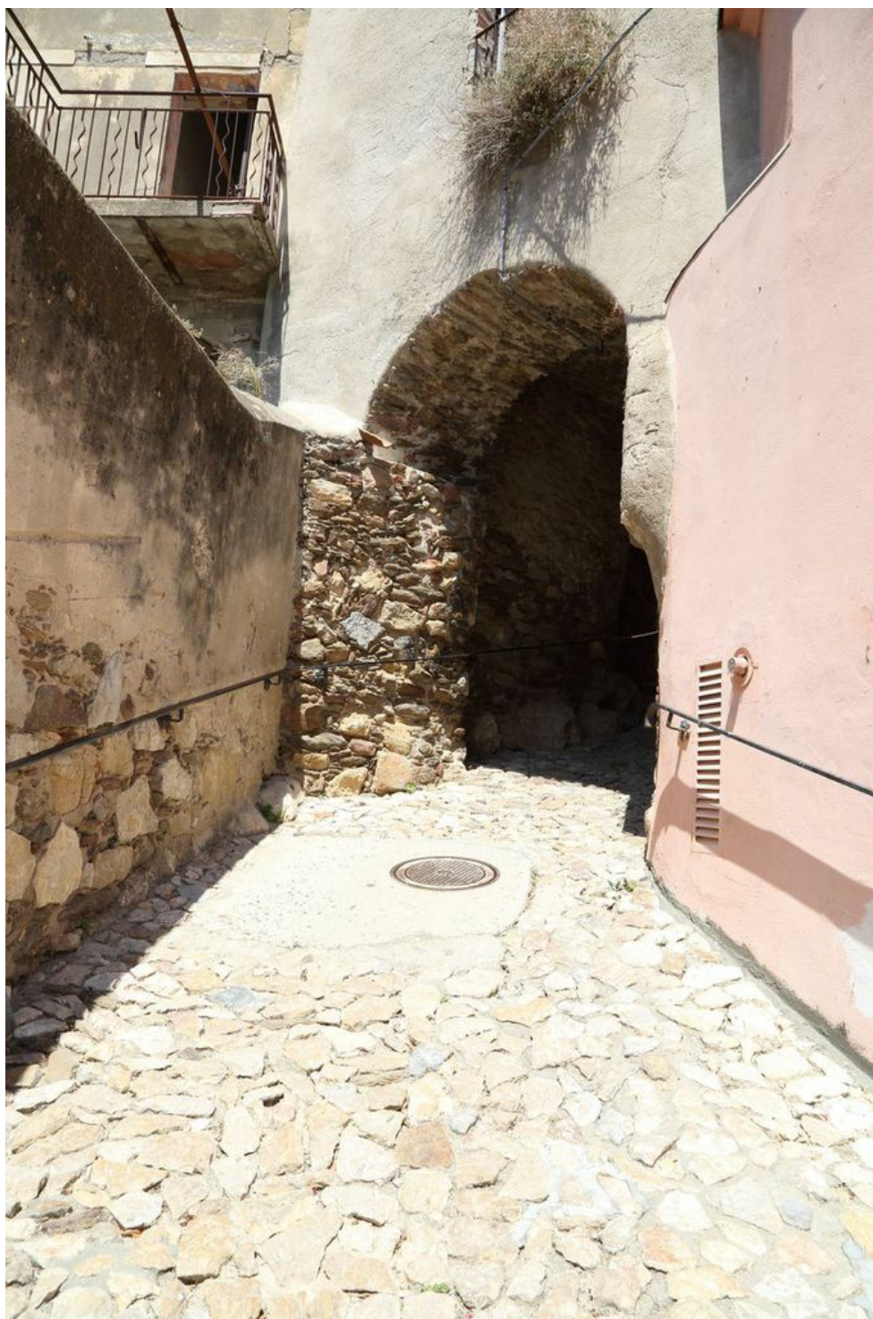
Fig. 2 - La deuxième porte du bourg de Posada, vue de l'extérieur.