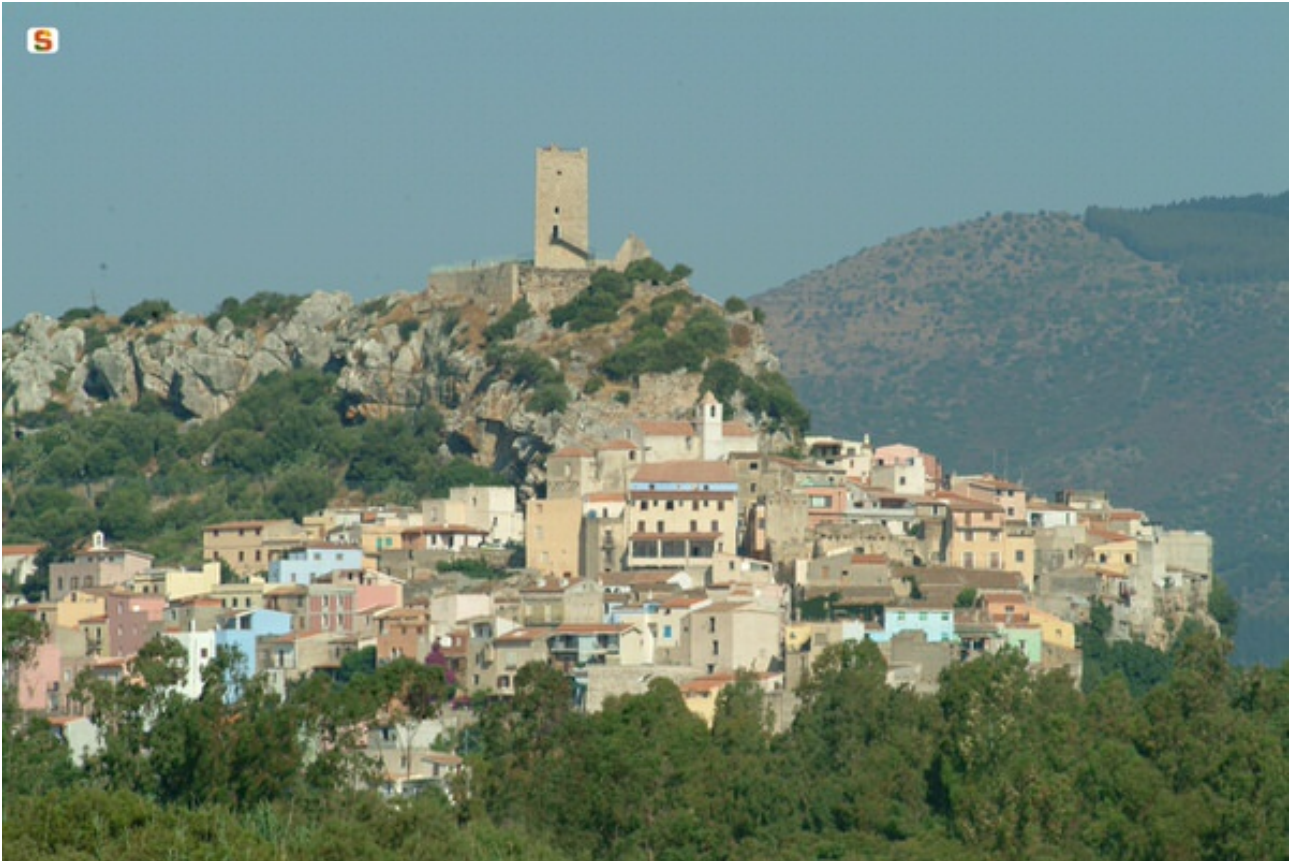
Fig. 1 - Le château « de la Fava » et le village de Posada ( http://www.sardegna.digitallibrary.it/index.php?xsl=626&s=17&v=9&c=4461&id=62931 ).

La forteresse « de la Fava » comprenait le château ainsi que le village fortifié. À l'origine, le bourg de Posada était probablement situé plus à l'ouest que la forteresse, dans la zone du quartier actuel de Santa Caterina. Ensuite, entre la deuxième moitié du XVe et le début du XVIe siècle, en raison de la guerre qui opposa la famille d'Arborée et les Aragon, et plus tard en raison des incursions sarrasines, les habitants se seraient transférés sur les flancs de la colline pour profiter de la protection du manoir. Par la suite, la forteresse de la Fava fut intégrée au nouveau bourg de Posada.