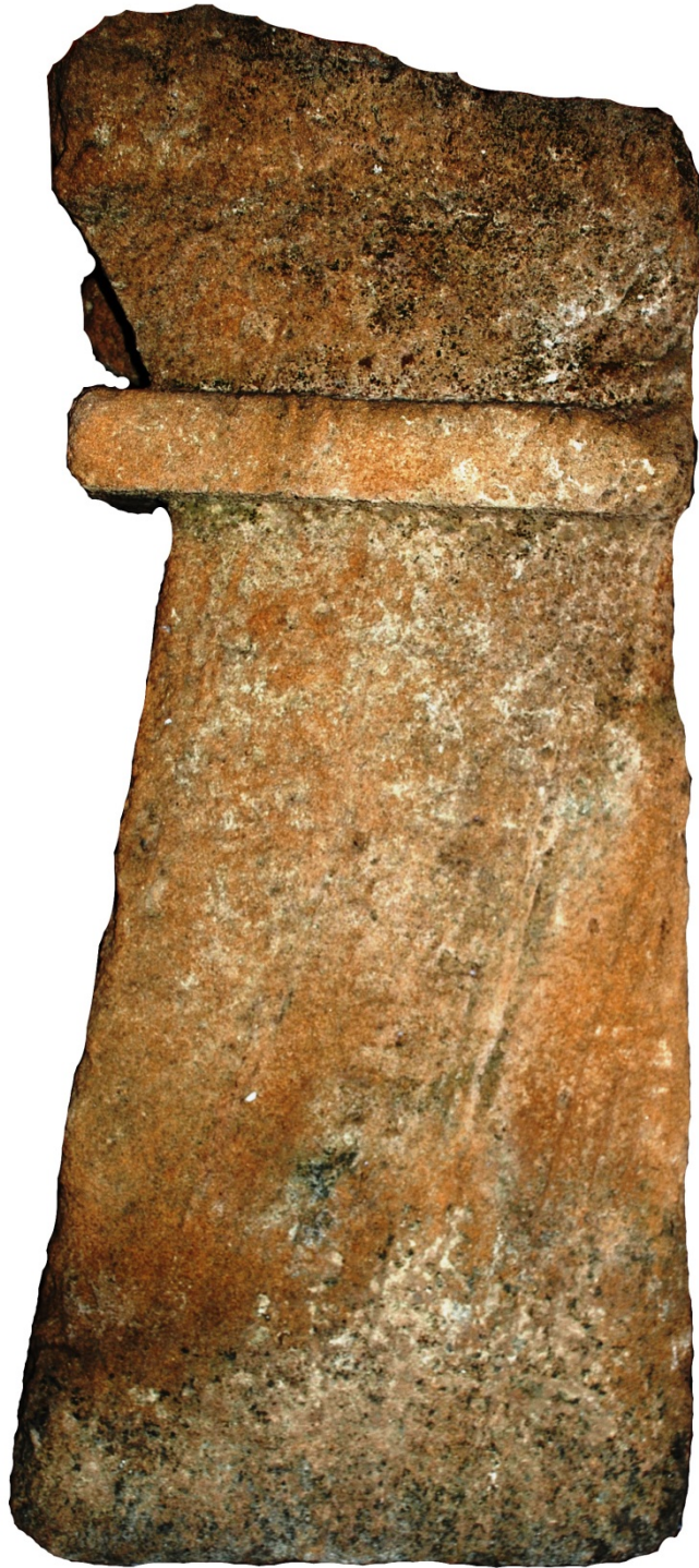
Fig. 2 - Cippe en grès provenant du tophet de Tharros (Oristano, Antiquarium Arborensis )